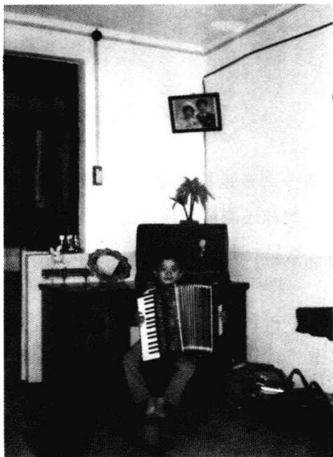
夏罡小时候在成都市第四十九中学的家里