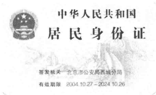
图 1-1 居民身份证正面式样

文字的证件有两种编排格式。例如一种是同时使用汉字和蒙文的证件，蒙文在前，汉字在后；另一种是同时使用汉字和其他少数民族文字（如藏、壮、维、朝鲜文等）的排版格式，少数民族文字在上，汉字在下。蒙古族身份证式样如图 1-3 所示。