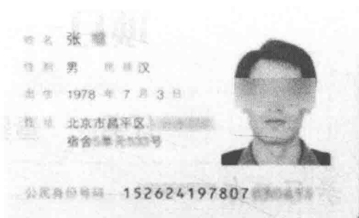
图 1-2 居民身份证背面式样