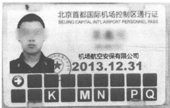
图 1-10 首都机场控制区通行证式样

用英文字母表示允许持证人通过（到达）的区域；用阿拉伯数字表示允许持证人通过（到达）的区域；用中文直接描述持证人通过（到达）的区域，如机场控制区、机场隔离区、停机坪等。控制区通行证式样如图 1-10 所示。