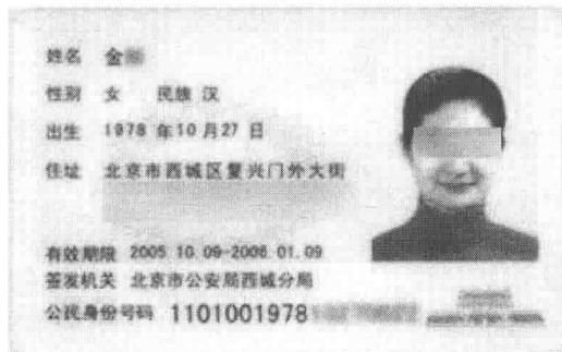
图 1-5 临时身份证背面式样

临时身份证背面应贴有本人近期照片，写明姓名、性别、民族、出生日期、住址（工作单位），有效期限、签发机关、公民身份号码，并在照片下方加盖骑缝章。临时身份证背面式样，如图 1-5 所示。