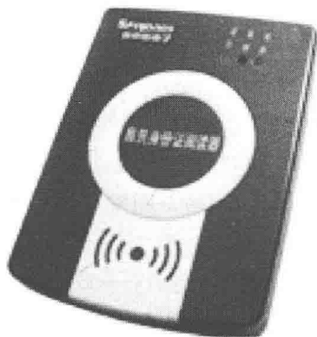
图 1-6 第二代身份证识别仪式样

(2) 验证员到达验证岗位后，将安检验讫章放在验证台相应的位置进入待检状态，查看二代身份证识别仪能否正常工作；检查安检信息系统是否处于正常工作状态，并输入ID号进入待检状态。第二代身份证识别仪式样如图1-6所示。