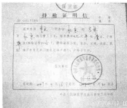
图 1-9 持枪证证明信式样