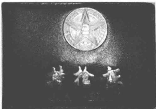
图 1-8 持枪证式样

知单》及存根书面通知机组，通知单交机组，存根由要客通道自行留存。持枪证式样如图 1-8 所示；持枪证证明信如图 1-9 所示。