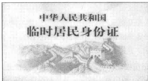
图 1-4 临时身份证正面式样

临时身份证的正面印有蓝色的长城、群山和网纹图案；印有黄色的网状图案，并在右上角粘贴印有天安门广场图案的全息胶片标志。矩形全息胶片标志规格为 12mm×9mm，由拱形环绕的天安门广场、五星和射线组成。图案呈多种光谱色彩。全息胶片标志粘贴在证件背面右上角，分别距证件卡上边和右边为 3mm。临时身份证正面式样如图 1-4 所示。