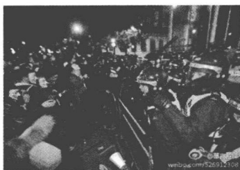
左图为 2014 年 11 月 5 日西方 40 城市百万人面具游行中的伦敦冲突。

下图为美国盖洛普调查结果：没有足够的钱买食物的人的比例，美国从 2008 年占 9%，增为 2011 年的 19%（中国从 2008 年的占 16%，下降为 2011 年的 6%）。