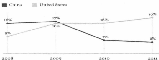
经济危机期间无论何种体制，社会矛盾都会全面爆发

下图为美国盖洛普调查结果：没有足够的钱买食物的人的比例，美国从 2008 年占 9%，增为 2011 年的 19%（中国从 2008 年的占 16%，下降为 2011 年的 6%）。