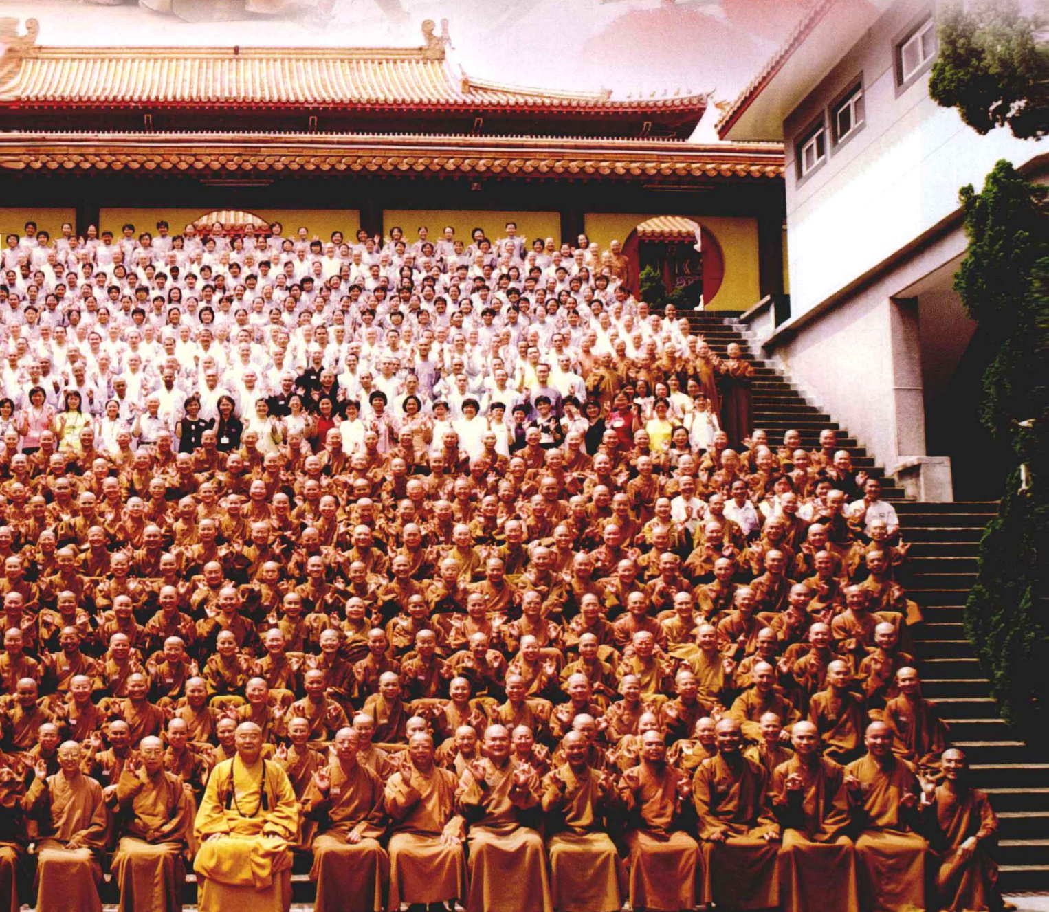
▲ 佛光山開辦各種教育事業，培養人才，傳遞佛教教育和研究的新火。 FGS has founded educational institutions to foster talent so that Buddhist education and research can continue.