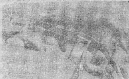
棋 盘 顶

冯山能说出战国和秦灭燕国的往事，四处慕名来访的人很多，连当时汉朝的东部都尉和武次县令，都来看望过他。按当时习惯，管他住的地方叫“冯山之居”，就是冯山的家的意思。年深日久，人们为了方便，就把“之居”两字去掉，单叫“冯山”了。当时他又去找两位老人下棋的那座山头，发现下棋老人已经不在，仅在平台上有大小不等的几个