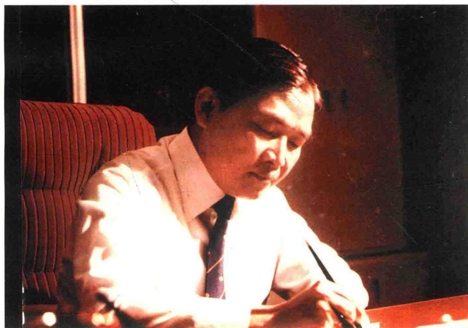
1979年，在中亚银行任职