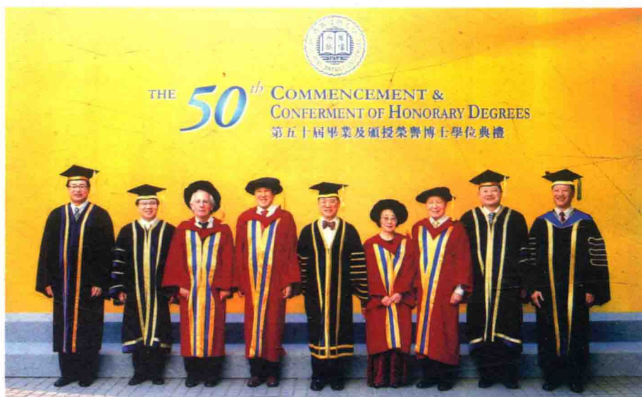
香港，2009年11月10日，与香港浸会大学（Hongkong Baptist University）颁发荣誉学位（Honorary Degree）的授勋者一起合影