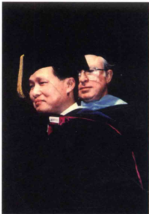
1984年，由金门大学（Golden Gate University）授予法学名誉博士