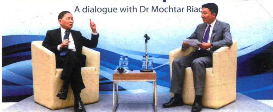
南洋理工大学商学院，作为主要发言人在院长就职典礼讲座上