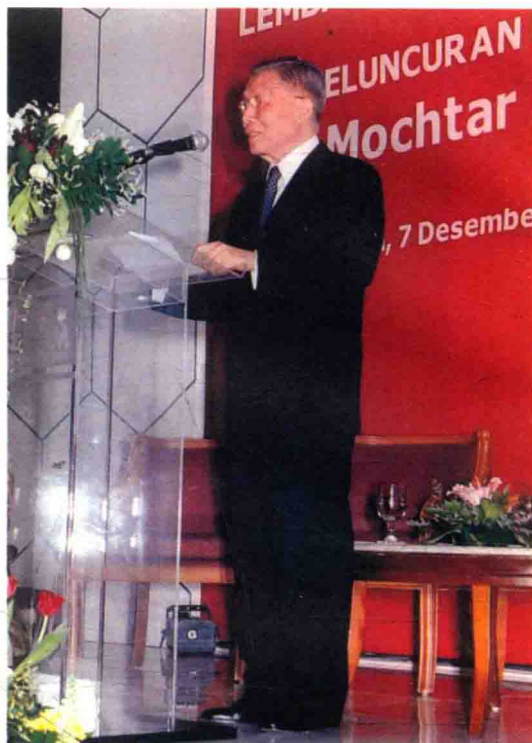
2008年12月7日，在雅加达华裔总会会馆举行《古圣哲理与现管理》一书的发布会