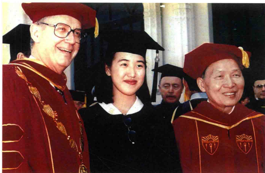
1996年，在孙女于南加州大学的毕业典礼上