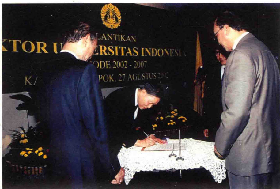
作为印尼国立大学的校务委员会主席，在新任印尼国立大学校长 2002 年至 2007 年任期的就职典礼上签字