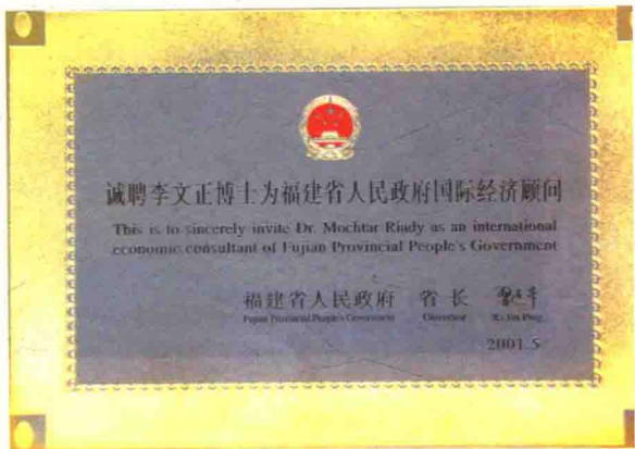
2001年，接受中国福建省政府的邀请，担任福建省人民政府国际经济顾问