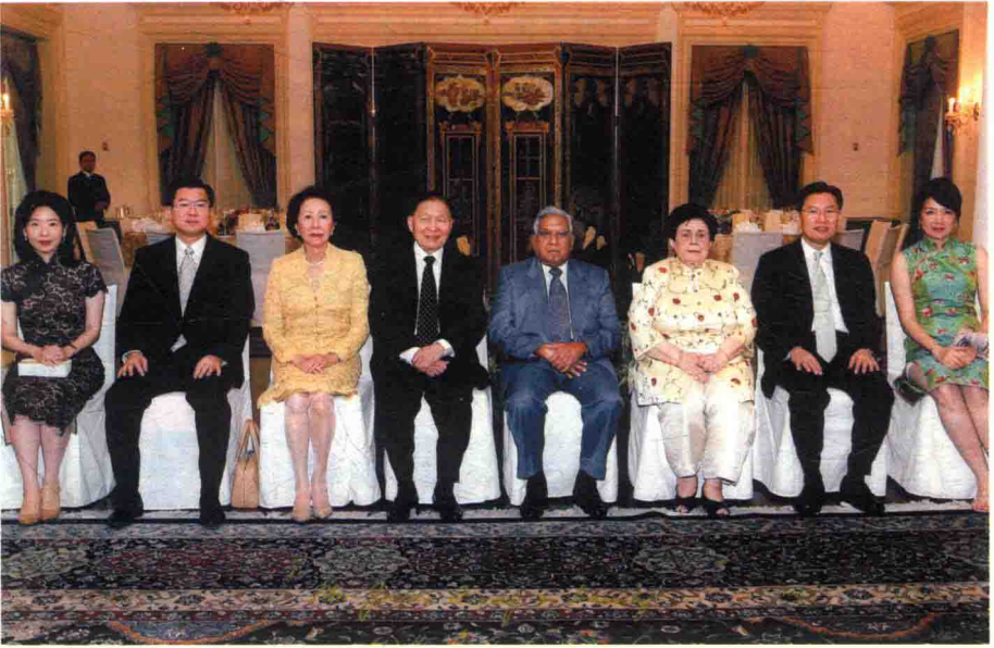
2007年11月9日，作为总统贵宾在新加坡总统府合影