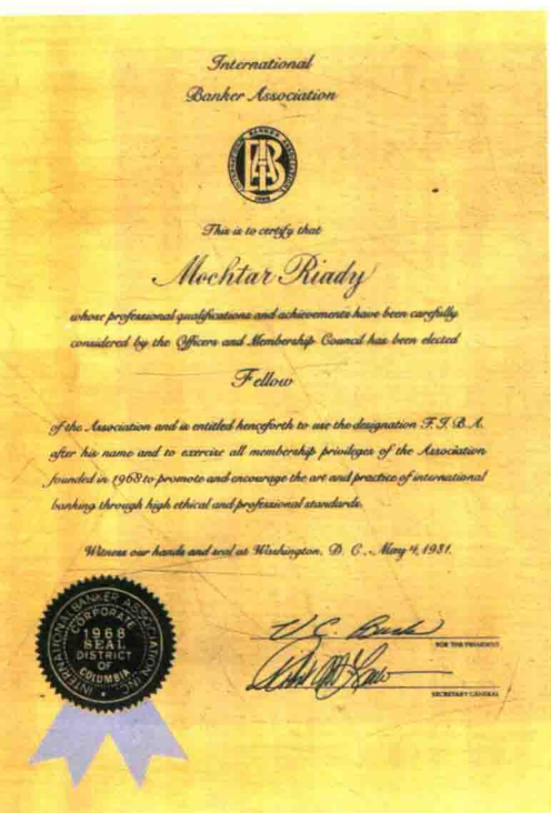
成为国际银行协会一员