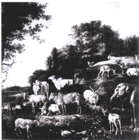
威廉三世在罗宫的动物园