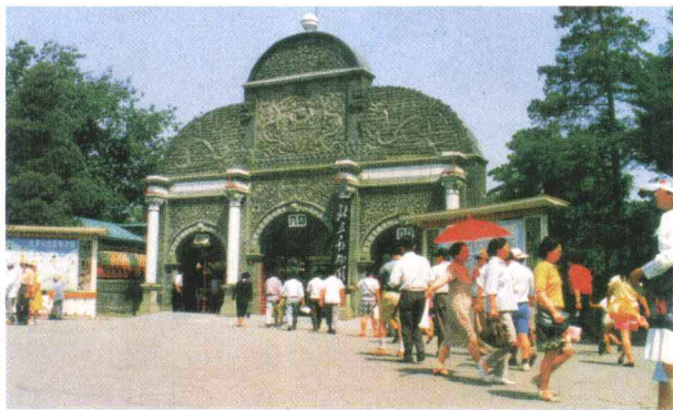
现北京动物园的大门就是当年“万牲园”的大门

19 世纪初，经济的发展带动城市的扩张，动物和植物被一起放到公园里进行展出。1828 年，