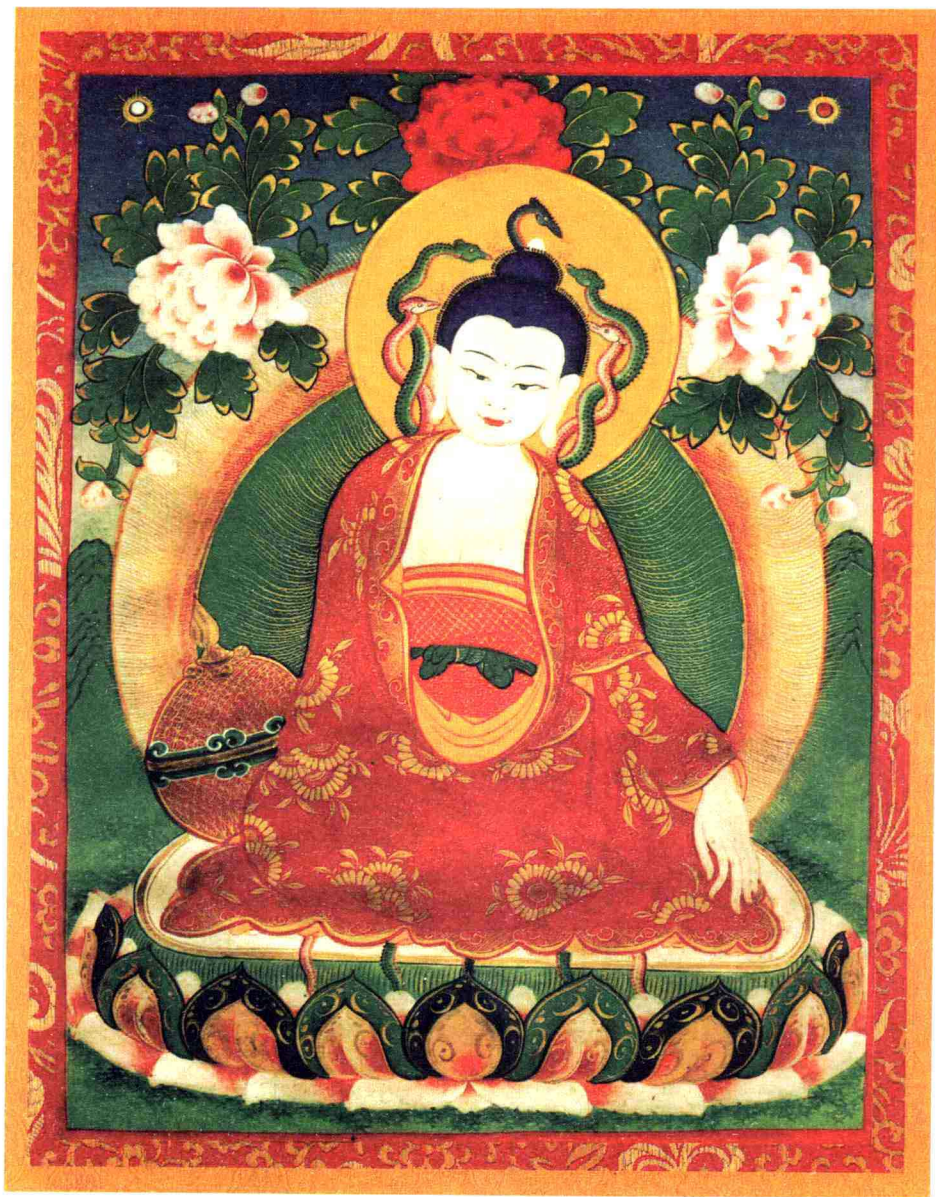
ལུང་ལྷུ་ནུ་པུ་ལོ། 龙树菩萨