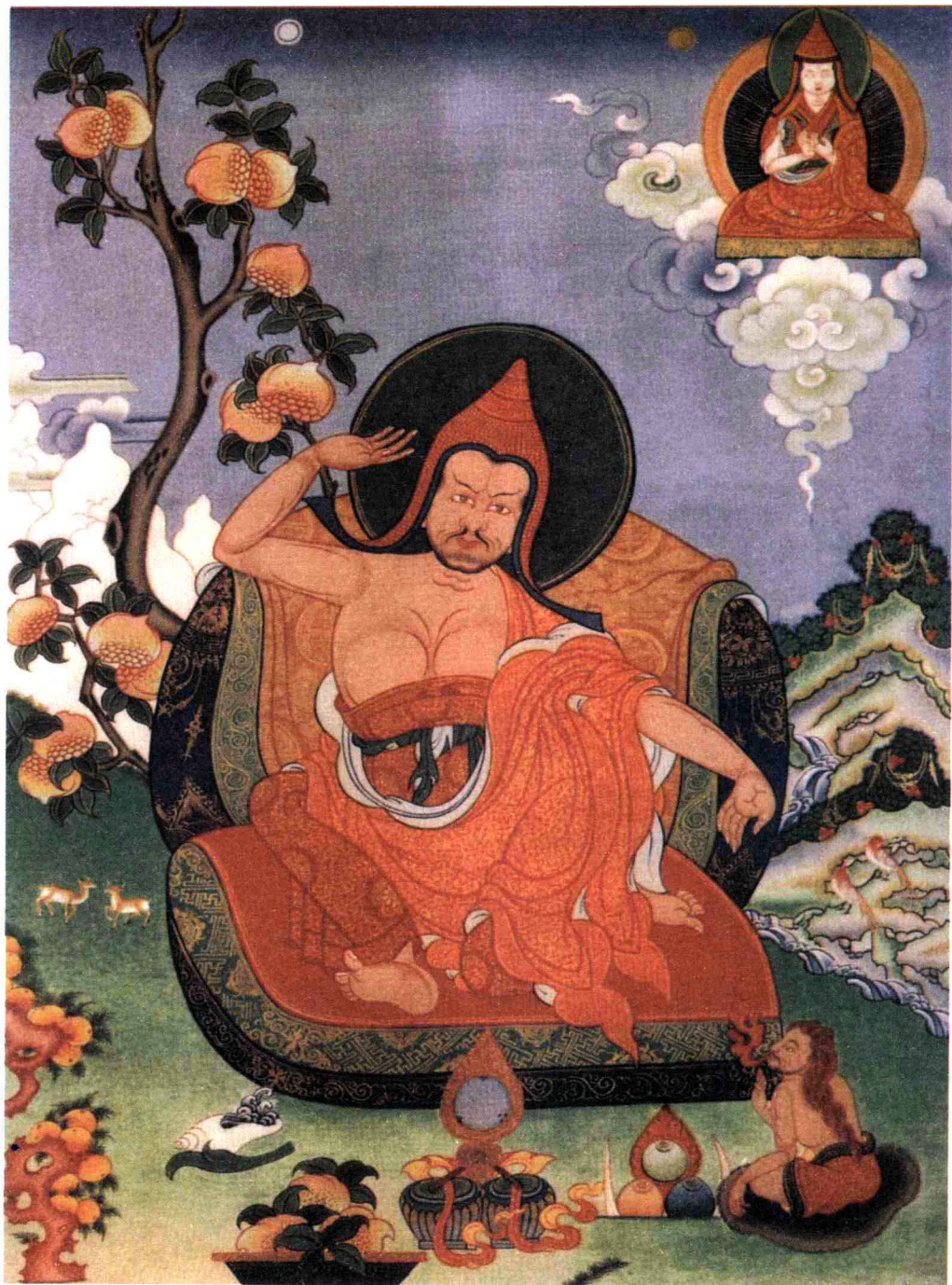
འོགས་ལྷན། 陈那菩萨