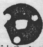
政和元 寤和銀 泉小品 大方師 贈與