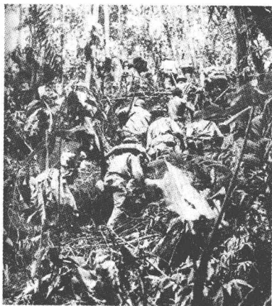
美军在瓜岛密林中艰难跋涉

然而，进入六月以后，形势开始有了变化。欧洲开辟了第二战场，最高司令部两年半以来给予欧洲战场的军事优先权已全部兑现，对德战争的胜利已经指日可待。在太平洋上，我军已经在塞班岛登陆。这是预告日