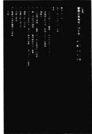
罗伯特·文丘里《建筑的复杂性与矛盾性》(伊藤公文译, 鹿岛出版会, 1991)