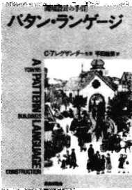
亚历山大《模式语言 环境设计手册》(平田翰那译, 鹿岛出版会, 1984)