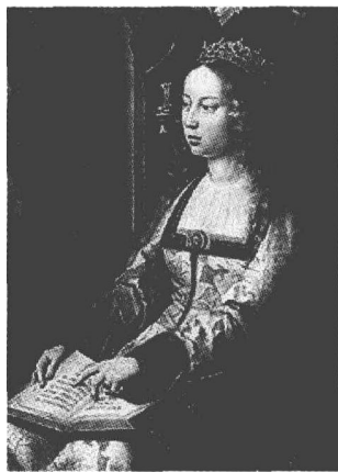
▲ 西班牙女王伊莎贝拉一世

成功之路从来都充满坎坷，为了实现航海梦想，哥伦布游说了十几年。可惜，没有人愿意给他投资，直到1492年，他的运气才开始好转。西班牙女王伊拉贝拉一世对他的航海项目产生了兴趣，估计这位女王闲得慌，手头的钱实在多得没处花。“傍”上这么一个富婆，哥伦布的事业之路变得顺畅得多。当然，哥伦布不忘对女王承诺：“今天你给我投资，后天我还你一个金库，那里