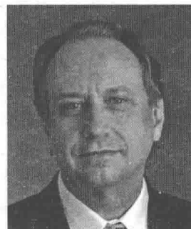
Rodney Brooks 美国麻省理工学院教授

机器人已经让人类着迷了几千年。在20世纪之前制造的机器人没有将传感和动作联系起来，只是通过人力或者是重复性的机器来驱动。直到20世纪20年代，电子登上舞台之后，才制造出了第一台真正感知世界并能恰当工作的机器人。在1950年前，我们开始看到流行杂志中出现了真正机器人的描述。20世纪60年代，工业机器人进入了人们的视野。商业压力迫使它们对环境越来越不敏感，而在它们自己的工程化世界中，动作却越来越快。20世纪70年代中期，在法国、日本和美国，机器人再一次在少数研究实验室出现。现在我们已经迎来了一个世界性的研究热潮和遍布世界的智能机器人大规模研究的蓬勃发展。本手册汇集了目前多个领域机器人的研究现状。从机器人的机械装置、感应和知觉处理、智能、动作到许多应用领域，本书都有涉及。