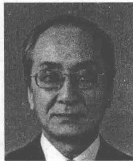
Hirochika Inoue 日本东京大学教授

随着机器人学科前沿知识的掌握，进一步的挑战为我们打开了将成熟的机器人技术应用于实际的大门。早期的机器人的活动空间给工业机器人的场所让路。内科机器人、外科机器人、活体成像技术给医生做手术提供了强有力的工具，这使许多病人免于病痛的折磨。人们期望诸如康复、卫生保健、福利领域的新机器人能够提高老龄化社会的生活质量。机器人必将会遍布于世界的每一个角落——天上、水下、太空中。人们希望能和机器人在农业、林业、矿业、建筑业、危险环境及救援中联手工作，并发现机器人在家务及在商店、饭馆、医院服务中的实用性。在无数的方式中，人们还是希望机器人可以支持我们的生活。然而，从这方面来看，机器人的应用主要受到结构化环境的限制，在这些环境中，出于安全考虑，机器人和人是相互隔离的。在下一个阶段，机器人所处的环境将扩展为非结构化的世界，在这里，人享受服务，将总是和机器人一起工作和生活。在这样的环境中，机器人将必须具备高性能的传感器、更加智能化、强化的安全性和更好的人类理解力。在寻求