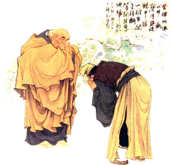
■ 韓愈禮大顛和尚（高嗣泰·蒲小雨繪）

在佛光山，秉持「集體創作、制度領導」的原則，依戒臘、學歷、年資、特殊才能等，設有序列等級制度，再依個人學業、道業、事業上的發心、精進、成就，作為晉升的依據。「三年一調」的職事制度，個人不戀棧、不濫權，