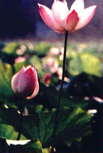
■清淨善美是佛教的道德標準

一、五戒十善是佛教的道德標準：佛教的五戒是做人應遵守的「根本道德」；十善是內心淨化、人格昇華的「增上道德」；因果業報則是世間不變的「善惡道德