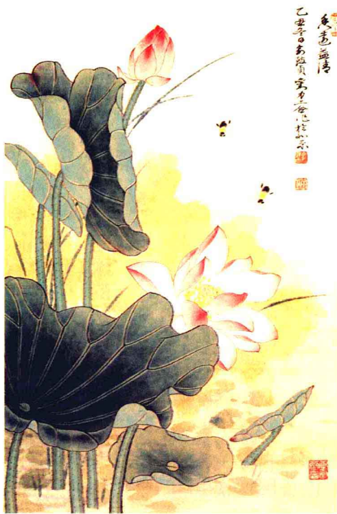
■般若自性，芳香清遠（劉力上·余致貞繪）

人有目，日光明照，見種種色。」有了如眼目的般若空慧，待人處事自然能你大我小，你有我無，你樂我苦，沒有比較的心；般若空慧也像「慈母」，看待一切衆生猶如親子，對其苦難自然有著不捨的同情；般若也像暗室的「光」，能照破心地的無明，銷融差別對待，心不被苦樂所動，把執著的凡情轉爲對衆生的慈悲。般若能淨化我們的思想，提昇我們的道德，有了般若空慧，苦樂是同體，淨穢是一如，貧富能自在，有無能平等，如《八大人覺經》所說：「常念知足，安貧守道，唯慧是業。」以般若空慧，如是降伏其心，「所有一切衆生之類，皆令入無餘涅槃而滅度之」。般若空慧是謂佛教的道德。