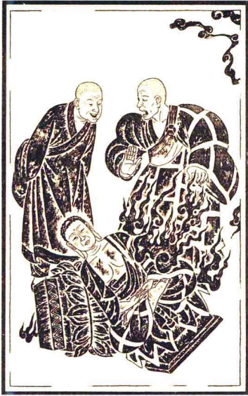
■丹霞禪師敬佛、燒佛

「五度如盲，般若爲眼」，吾人若無般若巧慧，即令做種種行持，仍是有爲的福報，不免五衰相現，非真正涅槃解脫之道。如：佛教的布施是要人學習捨棄慳吝之私念，但布施的來處，必須是清淨的，不違反國家的法律，同時施者心不驕慢，受者心懷感恩，是「能施、所施及施物，於三世中無所得；我等安住最勝心，供養一切十方佛」的清淨布施。此外，持戒不殺生、不妄語、不邪淫、不偷盜、不飲酒等固然是佛法，但佛陀的「殺一救百」 ① 、末利夫人的「飲酒救人」 ② 、一休和尚的「做人女婿」 ③ 、丹霞禪師的「燒佛取暖」 ④ 、石屋禪師的「教人偷心」 ⑤ 等等，也都是佛法。又慈悲柔和是佛法，但禪門中老師的棒喝、責罵、鉗錘，令學僧截斷妄想，識見本來面目，也是一種慈悲。因此，是佛法的，有時候不是佛法；不是佛法的，有時候反而是佛法。菩薩的「般若空慧」，能讓我們喜捨不作施想，持戒不著戒相，忍辱離於我執，精進不生驕慢，禪修不戀定境。