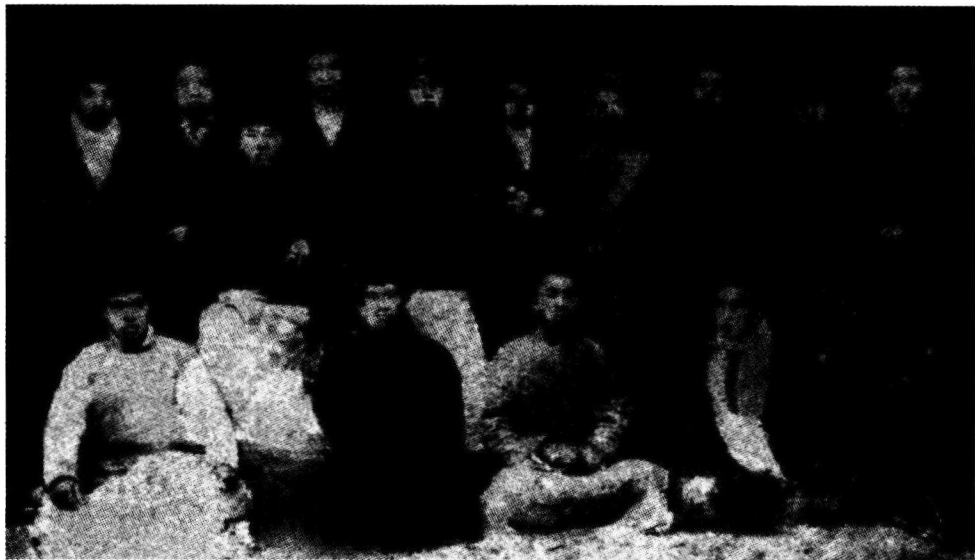
■ 1921年1月萧劲光赴苏留学。图为萧劲光、任弼时等四人赴苏留学前和送行朋友的合影，后排右七为萧劲光。

转眼半年过去了。1921年春节刚过，萧劲光等第一批赴俄学习的十几人，在刘少奇、罗觉（罗亦农）、吴芳的带领下，从吴淞港码头登上一艘日本客轮，开始了远涉重洋的赴俄之旅。