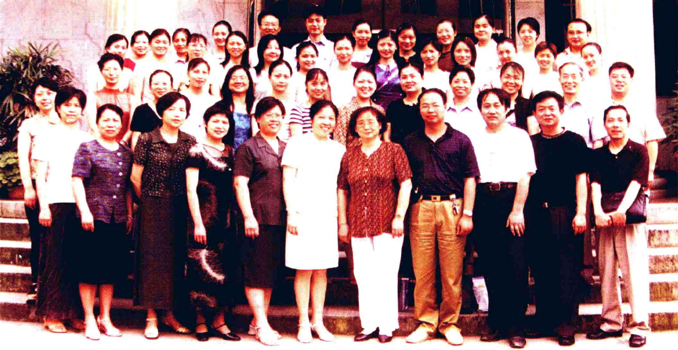
长沙市小学语文CAI软件的制作与使用课题组成员合影