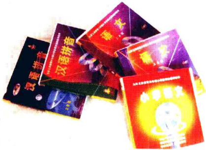
课题组部分研究成果