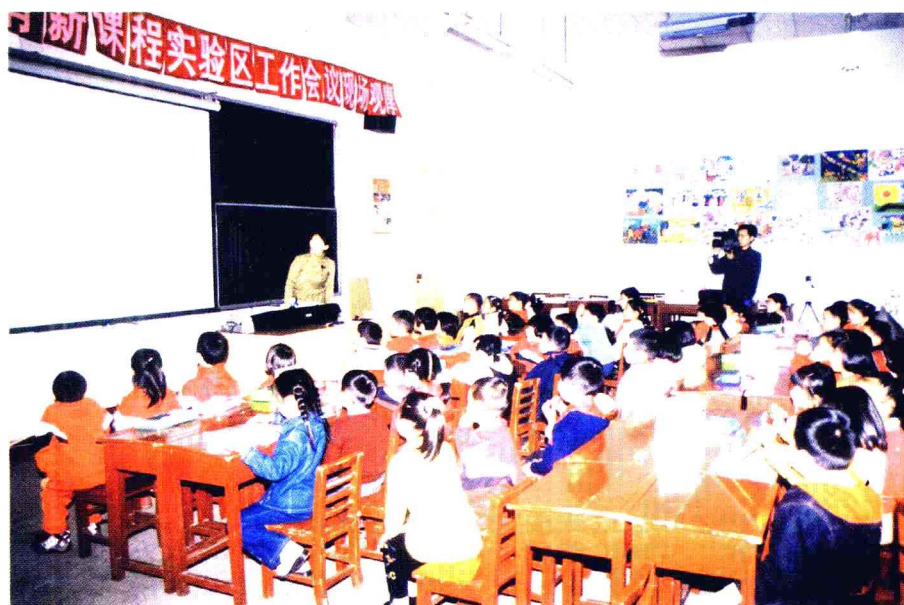
课题研究人员执教小学语文CAI观摩课