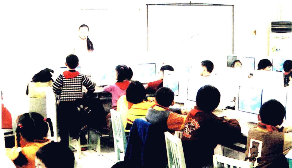
课题研究人员执教小学语文CAI研究课