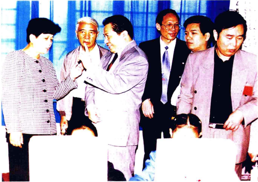
国务委员(原教育部长)陈至立同志(左一)、原国家教委主任何东昌同志(左二)、原副省长唐之享(左三)、原市委书记秦光荣(右二)等领导视察课题实验学校