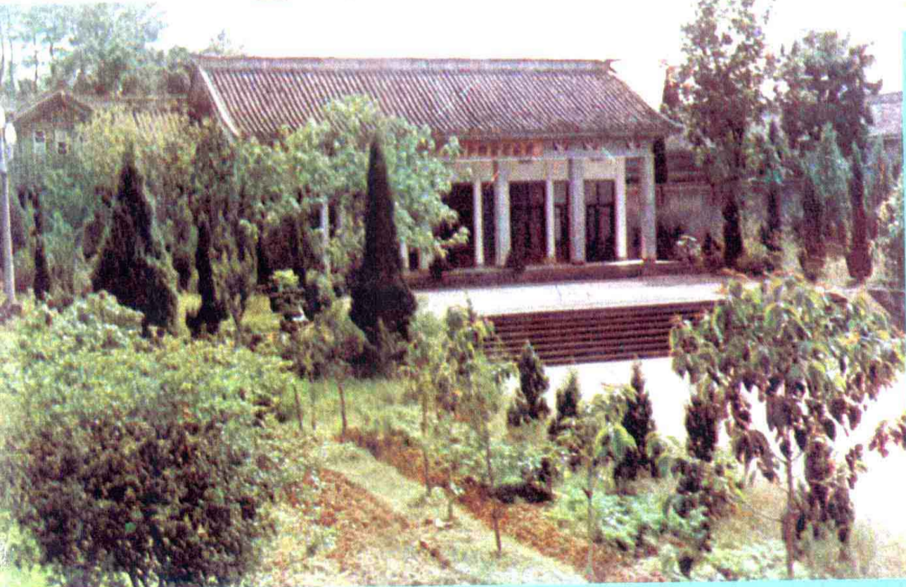
毛泽东作长冈乡调查陈列馆