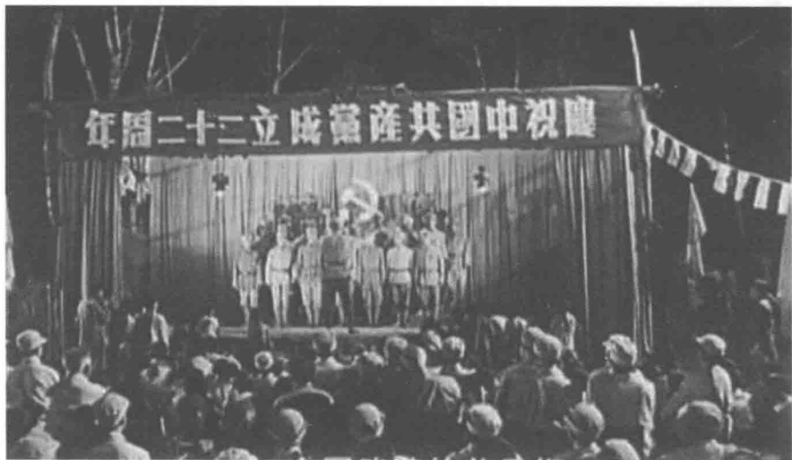
007. 幕布终于在掌声中拉开了。汽灯高悬，光芒刺目。十几个战士站成两排，一个个紧张而激动，直眉瞪眼地盯着指挥。