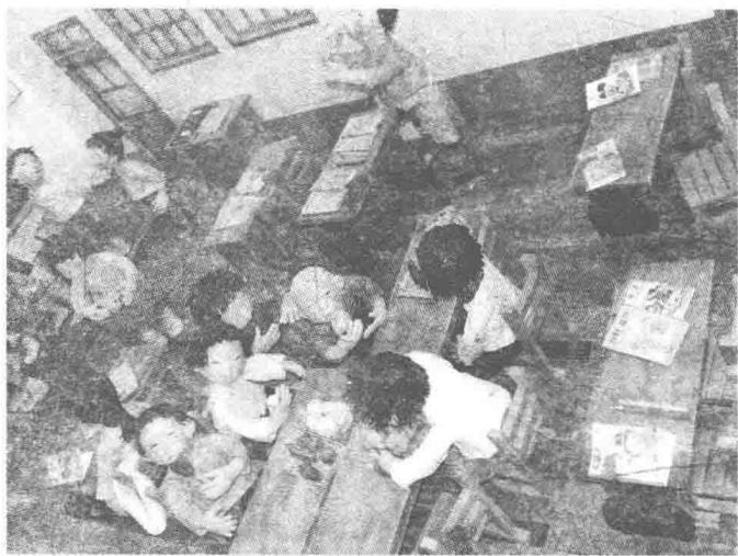
教育博物馆展示的情景

由社会各界有声望、有实力的、有兴趣的人员组成，主要是文化事业的奉献者，也是各项活动的提议者、支持者；咨询委员则是做了多年的理事后，由理事会选举产生，起到项目决策的作用；德高望重的理事或咨询委员能升任至副院长，也有的副院长为现任的或者退休的地方行政首长担任，而院长则多为退休的地方行政首长担当，顾问则为现任的行政首长或前任院长。其中，会员、理事、咨询委员需缴纳会费，且一级比一级多；副院长、院长和顾问可以不缴纳会费，也不享受薪资。但院长、副院长享受办公经费和政府提供的办公轿车服务，顾问层则没有这项内容。文化院的顾问、院长、副院长、咨询委员和理事都是由各行业、各界声望很高的人员担任，社会荣誉极高，其身份能得到社会的广泛尊重。