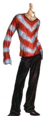
乔治·阿玛尼的设计草图