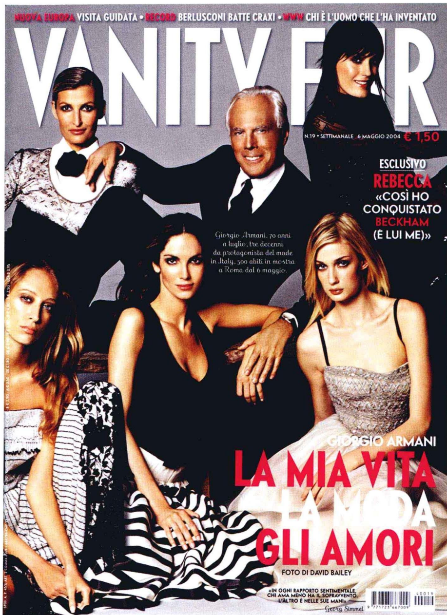
乔治·阿玛尼携他的模特们登上《名利场》封面