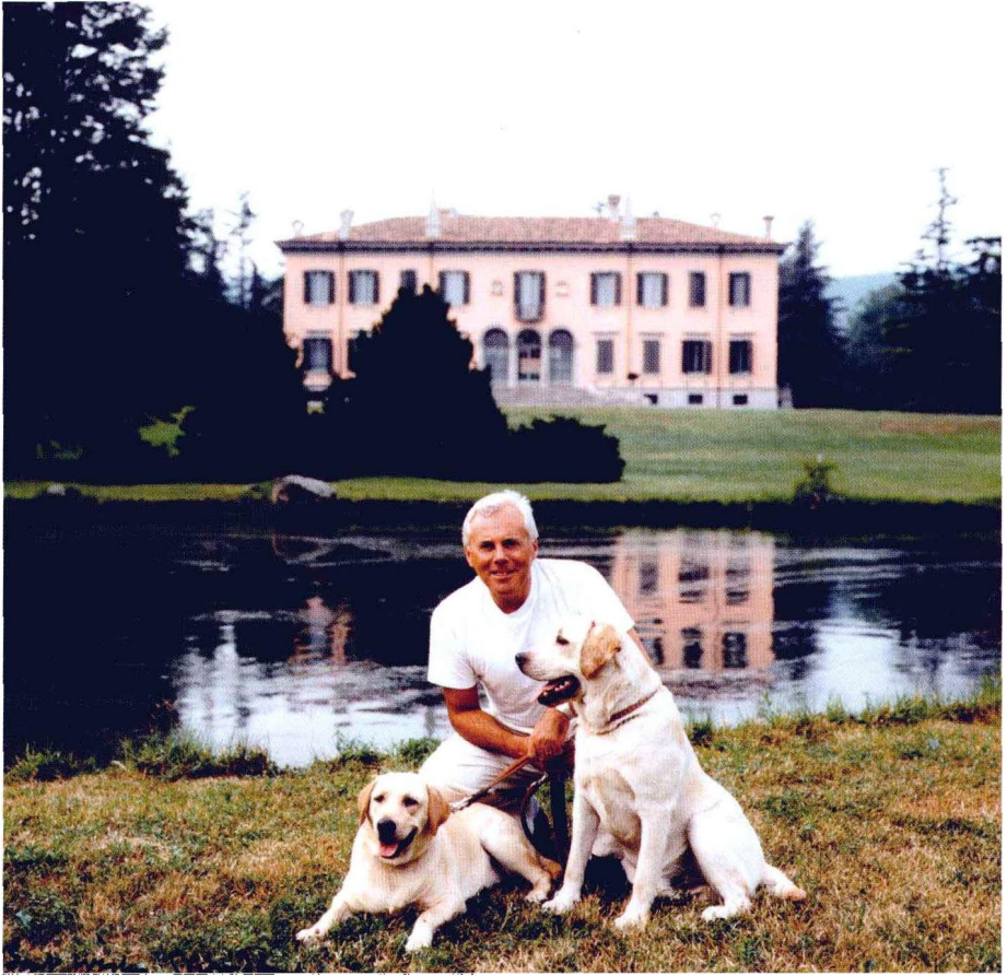
与爱犬在布罗尼共度周末