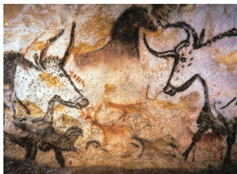
■—法国南部 拉斯科洞窟壁画

这一时期具有代表性的是洞窟绘画、岩画、圆雕及骨雕等。从法国南部到西班牙北部，曾被发现有多处洞窟绘画，大约产生于公元前3万—2万5千年前。其中，法国南部的拉斯科洞窟与西班牙的阿尔塔米拉洞窟里的壁画是较为有名的。这些壁画大多以动物为对象，在表现手法上原始的写实手法和抽象的点线符号混杂。旧石器时代的小雕像以奥地利的“威