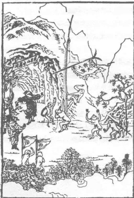
官封弼马心何足 名注齐天意未宁

这茬儿根本不在猴子的计划之内。唐虞揖让三杯酒，汤武征诛一局棋， ① 改朝换代天翻地覆，常常也就是个一不留神。