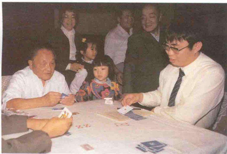
与聂卫平等打桥牌