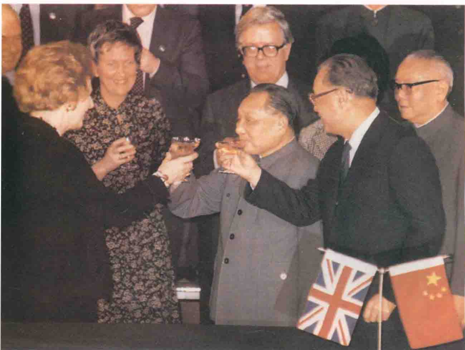
1984年香港问题用一国两制的方式得到解决