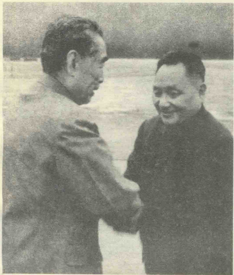
周恩来为出席联大特别会议的邓小平送行