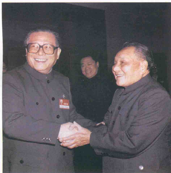
1989年确立以江泽民同志为核心的党中央