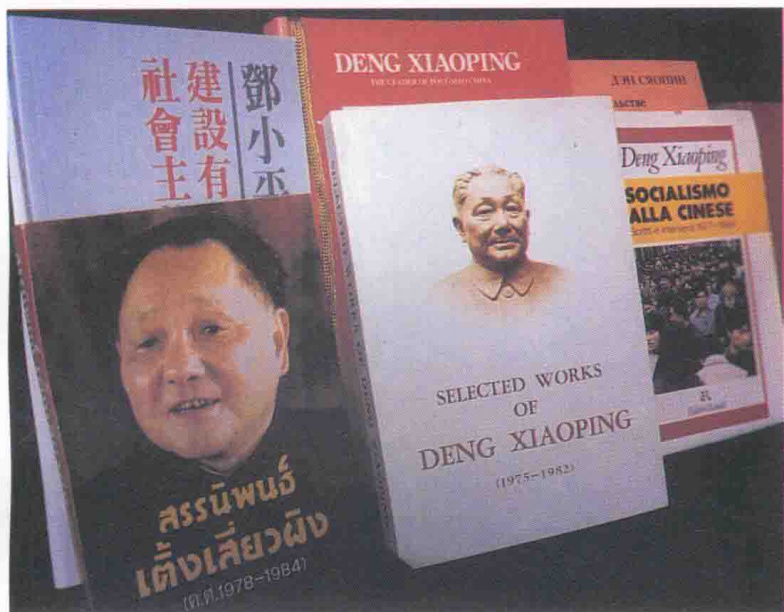
邓小平同志部分著作的外文译本