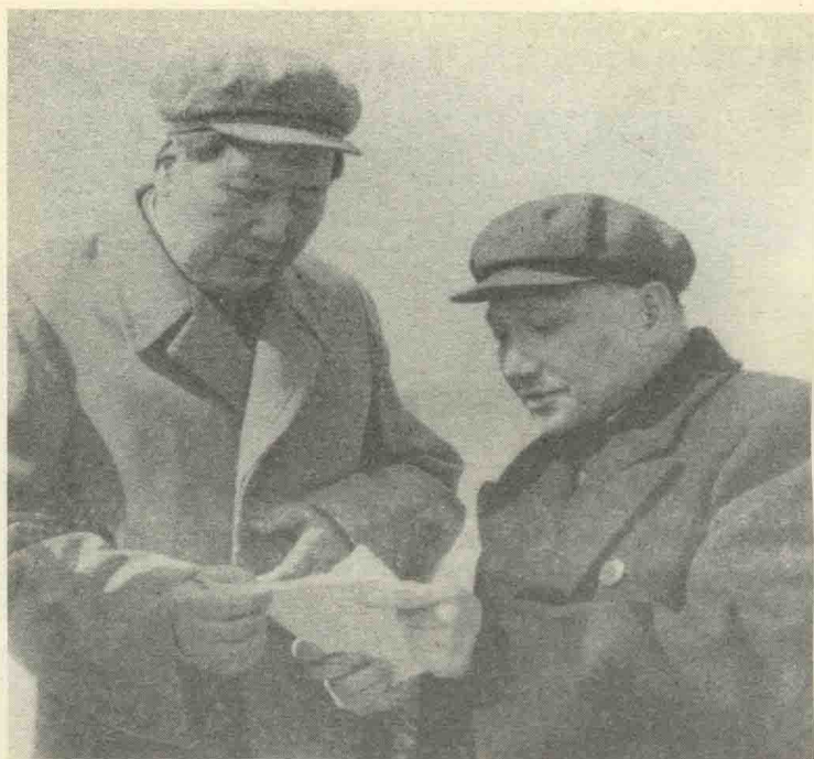
邓小平与毛泽东同志研究工作