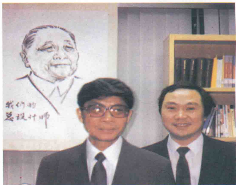
台湾《中国时报》大陆新闻部资料室