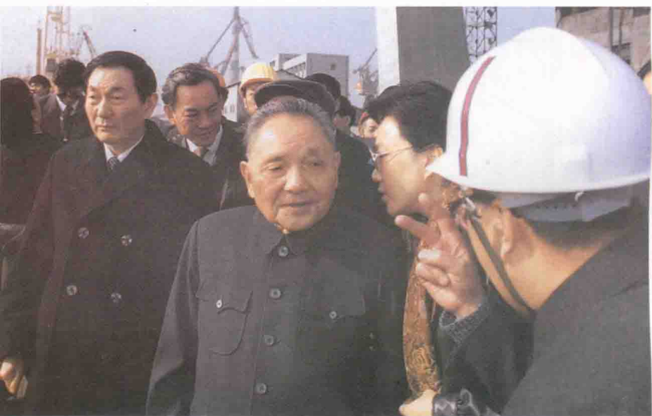
1991年在上海视察工作