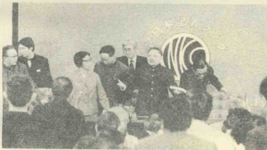
1978年访日举行记者招待会