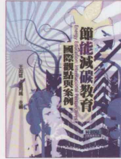
節能減碳教育： 國際觀點與案例 王如哲、黃月純主編