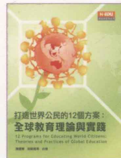
打造世界公民的12個方案： 全球教育理論與實踐 陳麗華、田耐青等 合著