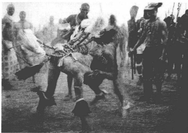
图 1-2 苏丹黑人的勇士舞 ①

狩猎民族的舞蹈，主要是摹仿各种动物的动作和再现狩猎的过程（如图 1-2），甚至本身就是劳动生产的一个有机组成部分，比如，跳野牛舞是为