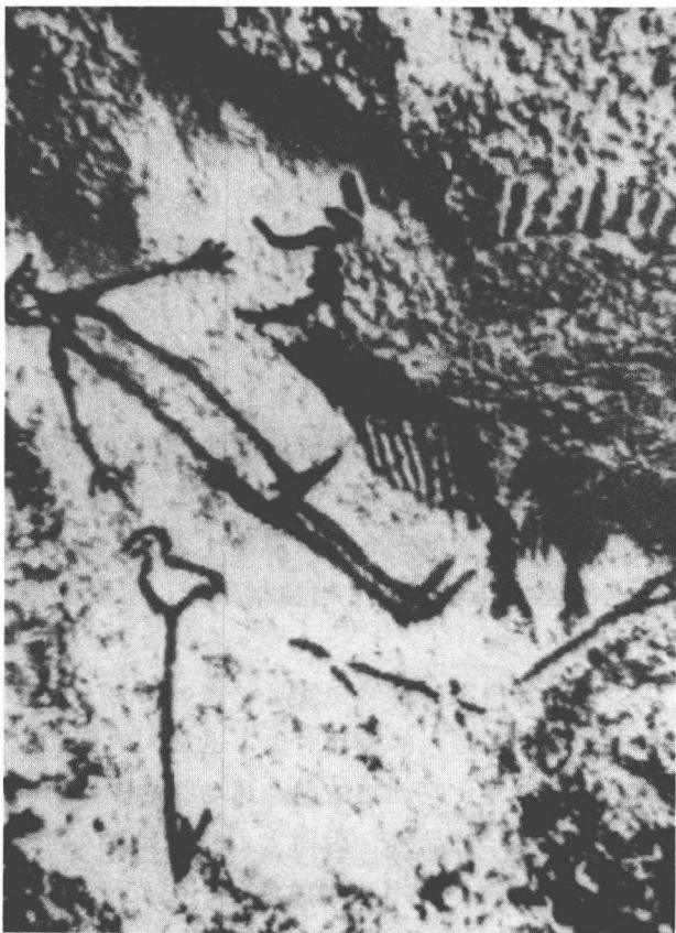
图 1-1 拉斯科岩洞壁画

法国的拉斯科岩洞壁画为距今 2 万年的旧石器时代的绘画遗迹，也是迄今为止发掘到的最大的原始艺术洞窟。这个洞的入口处是较宽敞的大厅，为主洞，在主洞岩壁的正反面有一幅十几米长的牛群行走的壁画，其中有长达 5 米的巨大牡牛，形象雄健。在走廊、地下室与半圆形的洞穴的岩壁上画满了马、山羊、公牛、母牛、驯鹿、棕熊等组成的动物群。这些动物多数呈活动状态，有奔走、呼叫、俯首、挣扎等，形态生动，色彩明快。在底层石台上，还可以看到受伤的野牛撞倒鸟首人的惊险场面。野牛后屁股处有一长矛，显然是被猎人投矛击中的。它似乎是在狂奔中以锋利的双角将前边拦截的人刺倒在地，这人四肢伸直躺在那里，脚下有一条横线应该是他的武器（如图 1-1）。这些岩洞壁画记载着原始人类狩猎生活的生动情景。