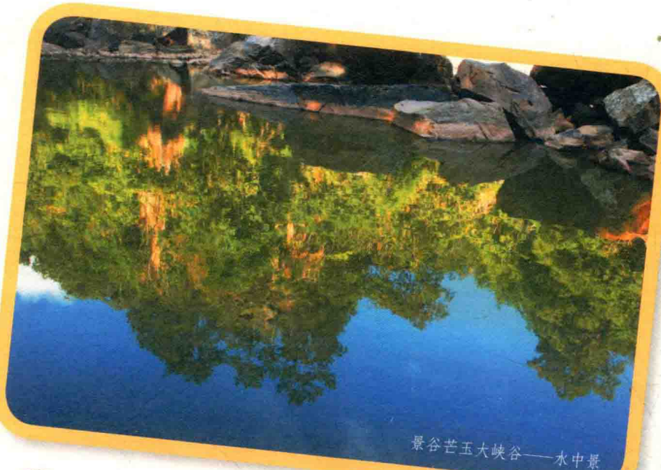
景谷芒玉大峡谷——水中景