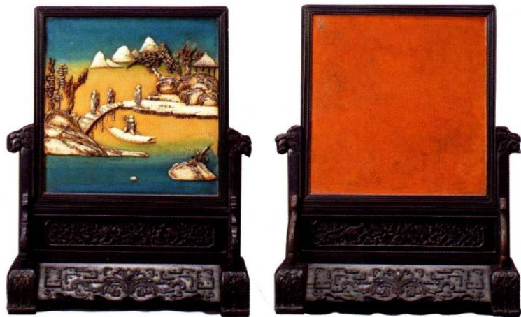
紫檀嵌象牙蓬莱仙境砚屏