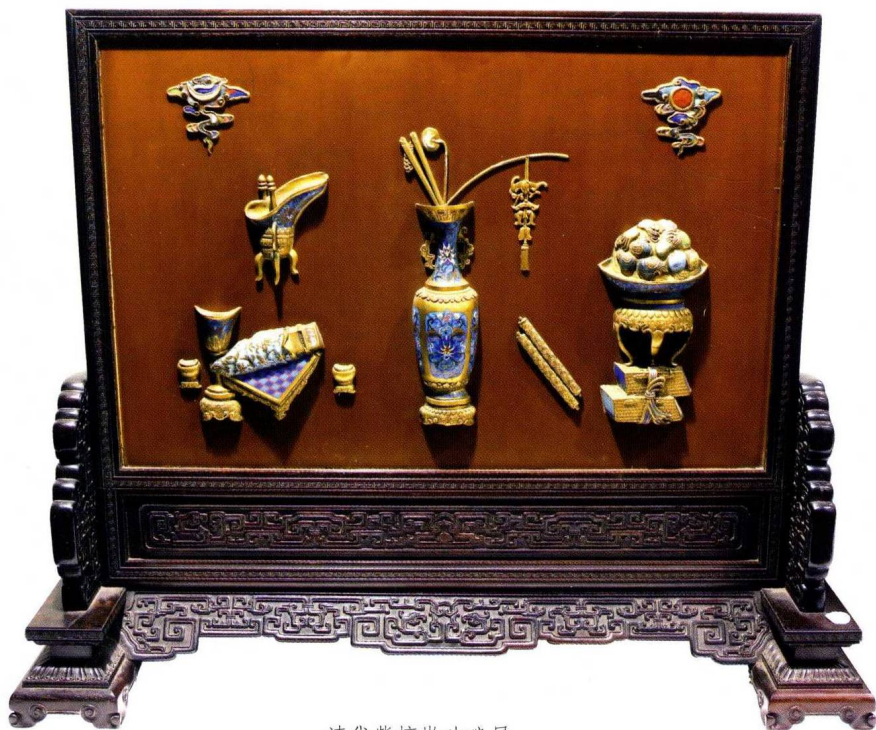
清代紫檀嵌珐琅屏