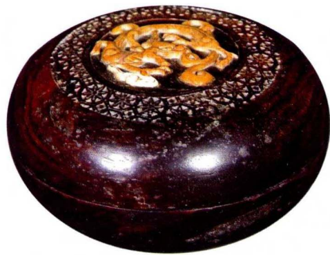
紫檀嵌黄寿山香盒