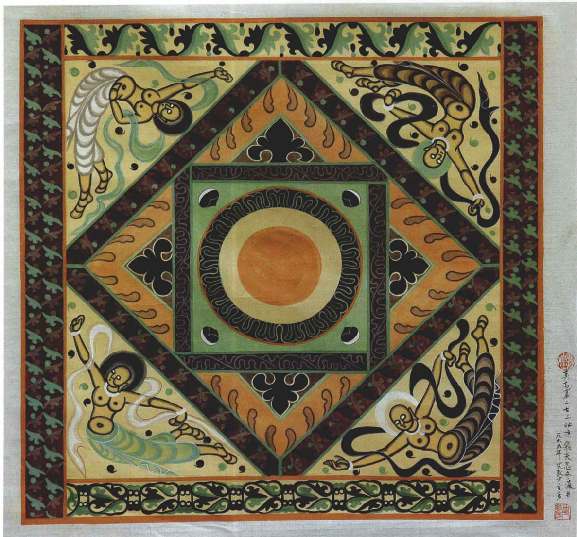
5 飞天忍冬藻井 56 cm × 56 cm 纸本 第 272 窟 北凉

飞天忍冬藻井：第 272 窟，北凉（公元 421 年~439 年）。此窟的藻井是莫高窟最早的一个。塑出三层叠涩方井，施以彩画，方井中心倒悬一朵大莲花，内层岔角饰以火焰纹、云气纹边饰。藻井取形、用笔都具有简练朴实的特色。