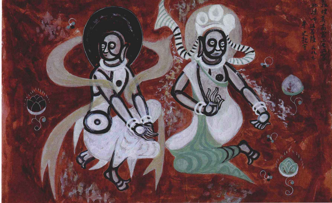
3 听法菩萨 66 cm × 45 cm 纸本 第 272 窟 北凉

听法菩萨:第 272 窟,北凉(公元 421 年~439 年)。此窟菩萨头戴三珠冠,项饰璎珞,肩披彩巾,腰束长裙。