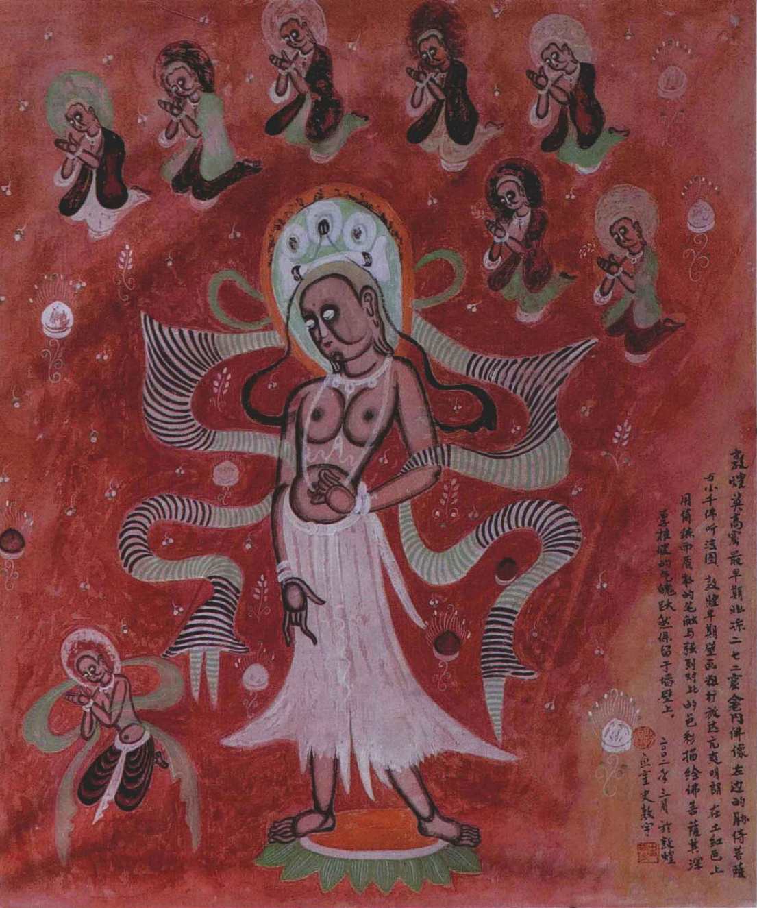
1 胁侍菩萨 80 cm × 67 cm 布本 第 272 窟 北凉

胁侍菩萨：第 272 窟，北凉（公元 421 年~439 年）。此胁侍菩萨在西龕内塑像右侧，身体比例适度，长发垂肩，两目下视，上身微侧，右臂前曲扬掌，左手贴膝，足蹬莲花。头戴三珠宝冠，冠带飘举，颈挂项圈，胸垂璎珞，肩披彩巾，腰系长裙。菩萨情态文静、高雅。人体轮廓和面部、眼眶上的圆圈叠染，表现出天竺绘画凹凸法的特点。由于叠染部分变为黑色和表层勾勒的定形线的剥蚀，现在看到的晕染笔触，给人以粗犷放达之感。