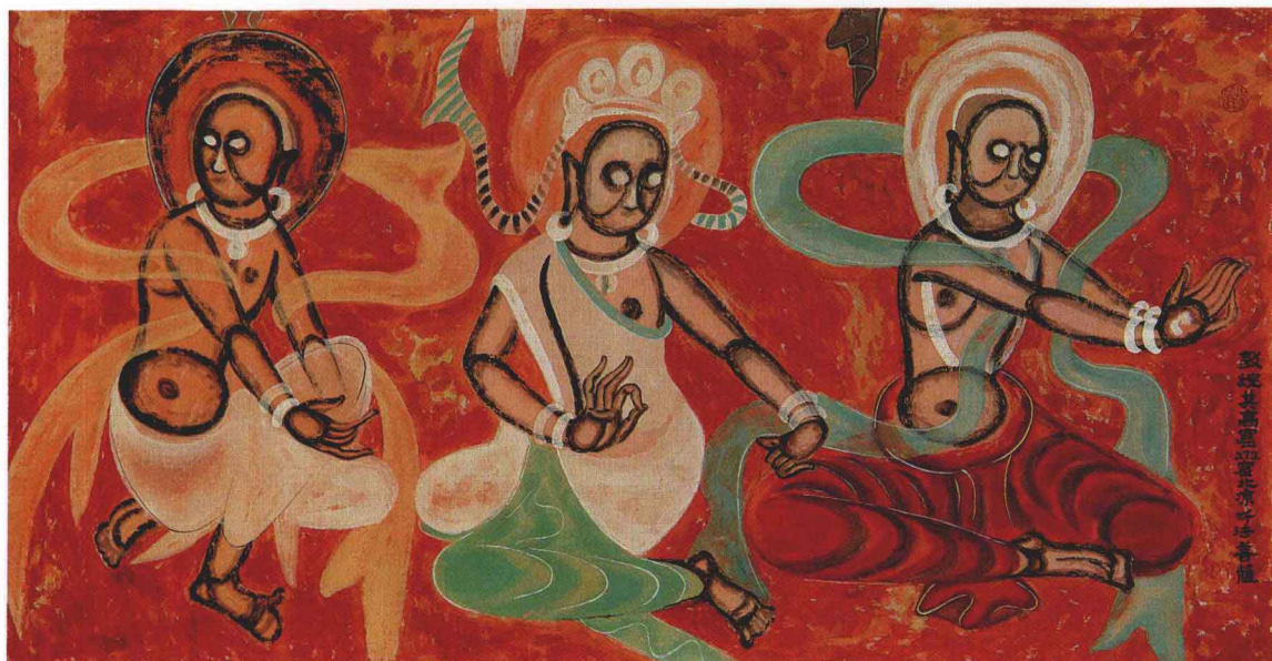
4 供养菩萨又听法菩萨 88 cm × 50 cm 纸本 第 272 窟 北凉

听法菩萨:第 272 窟,北凉(公元 421 年~439 年)。此窟菩萨头戴三珠冠,项饰璎珞,肩披彩巾,腰束长裙。