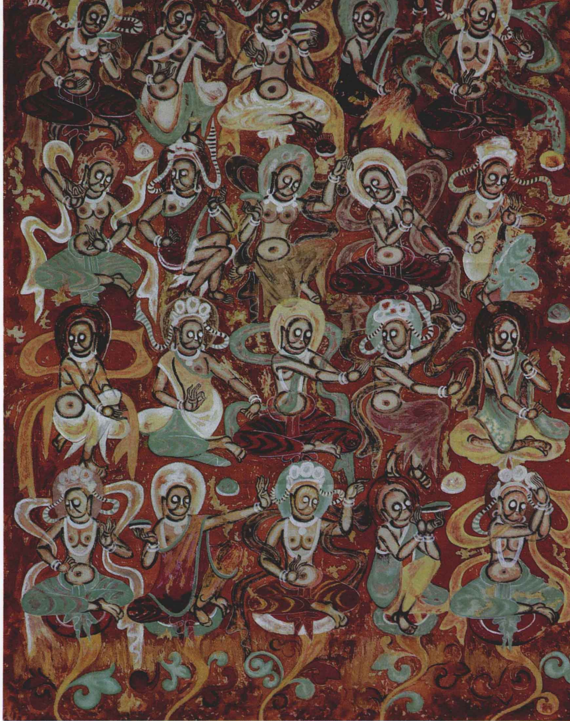
2 坐式供养菩萨 100 cm × 77 cm 布本 第 272 窟 北凉

坐式供养菩萨:第 272 窟,北凉(公元 421 年~439 年)。指西壁南侧的供养菩萨,头戴宝冠,身着长裙、披巾、天衣。上下四层,每排五身均匀地排列,舞姿轻柔,姿态互异,而又和谐统一,可以说这是一幅优美的群舞图。