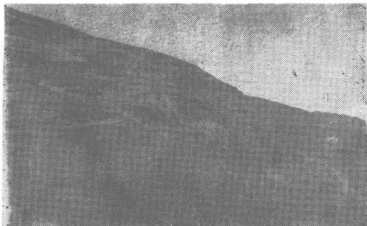
△陆宗荣、禄发奎烈士牺牲之地——团箐转老包梁子