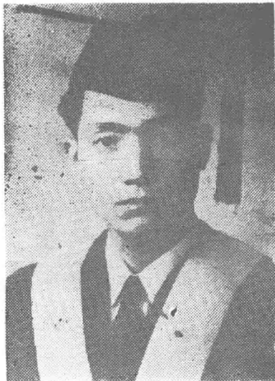
▷中国人民解放军四十三师一二九团政委李锋刚烈士遗像。