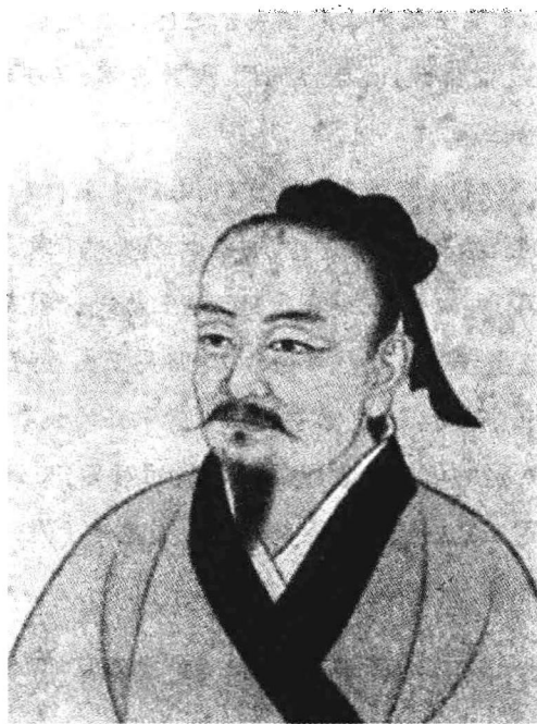
范蠡(生卒年不详)字少伯,号陶朱公,楚国宛(今河南省南阳市)人,春秋末期越国上将军,被誉为“中国商圣”