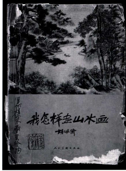
李秉正读过的启蒙书