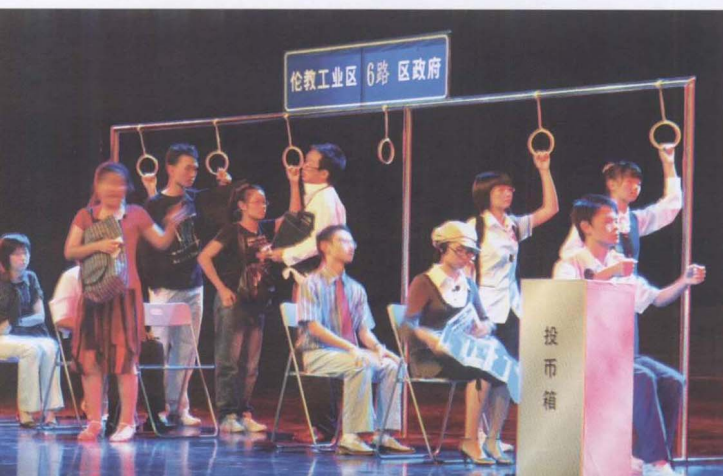
←我校获区文 艺汇演一等奖第 一名节目：小品《爱 心之旅》