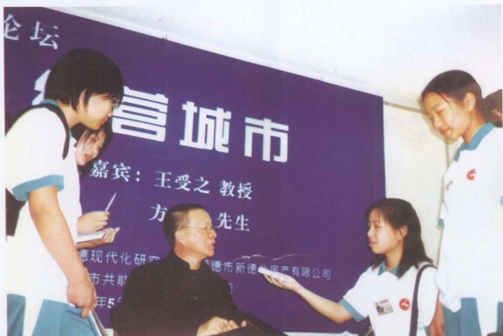
→ 文学社小 记者在顺德经 济论坛中采访 王授之教授