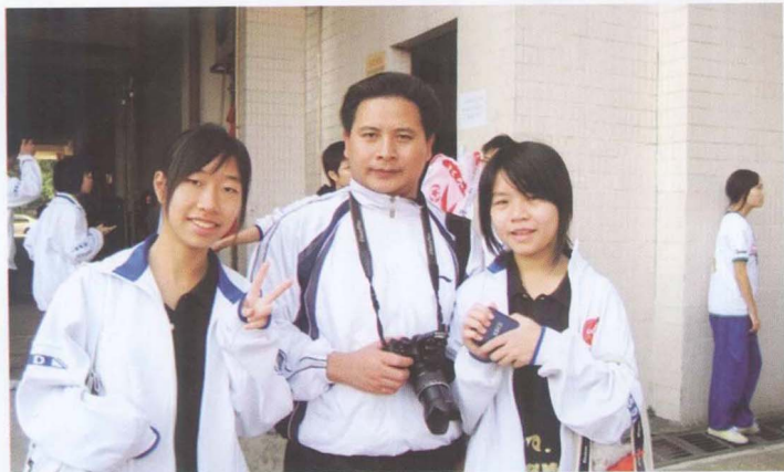
← 指导老师与 小记者在一起