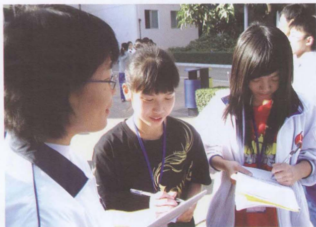
← 文学社小记者 在体艺节现场做新闻 采访