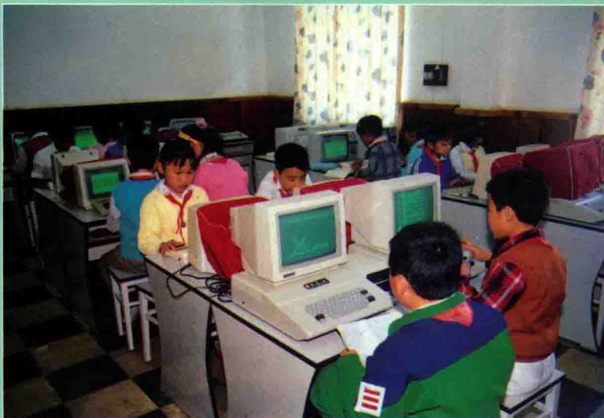
小学生学习 计算机