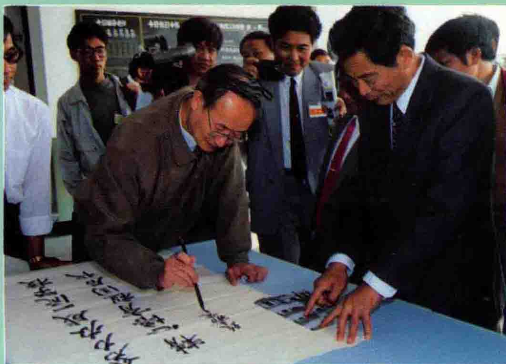
国家教委副主任王明达为嘉定教育题词