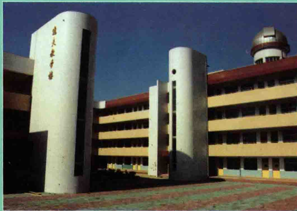
普通小学逸夫教学楼