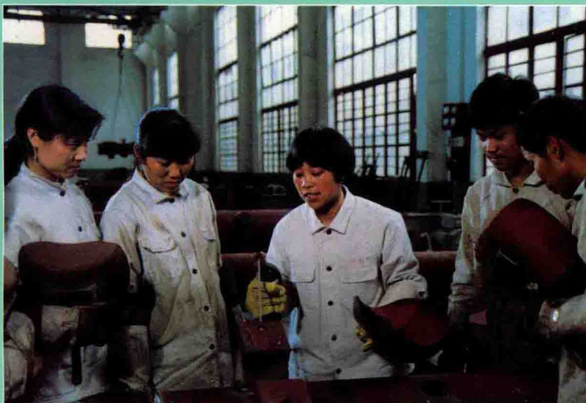
老师指导职业班 学生电焊操作