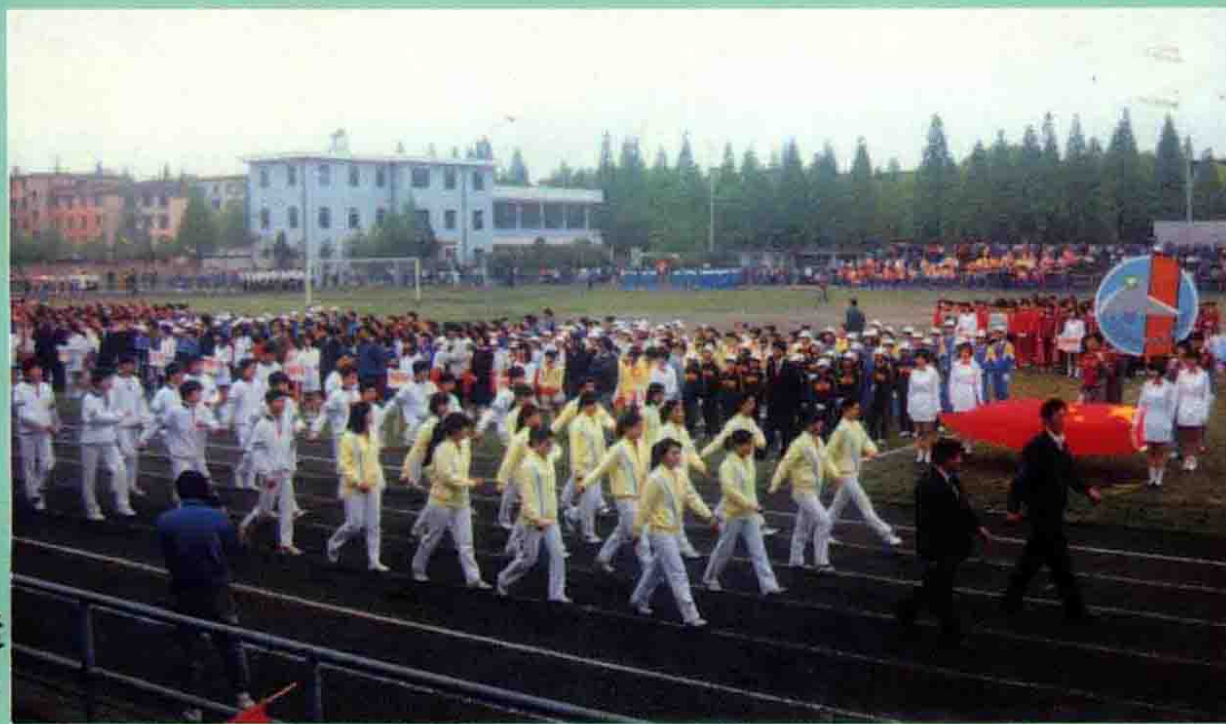
中小學生田徑運 動會開幕式