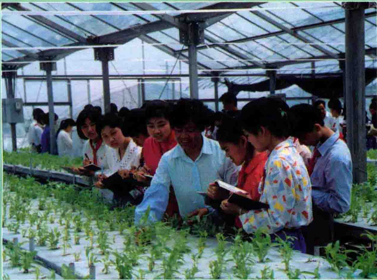
学生学习农业 栽培技术