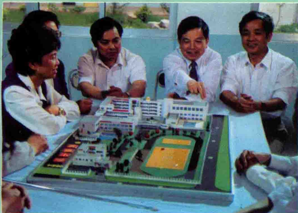
区委、区政府领导在普通 小学工地现场办公