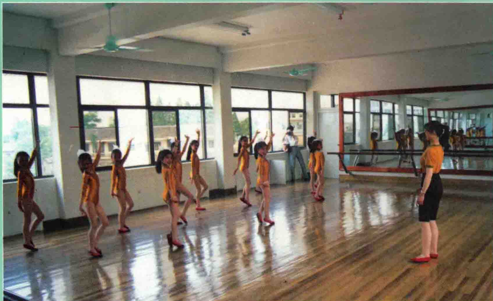
少年宫舞蹈班学员在活动