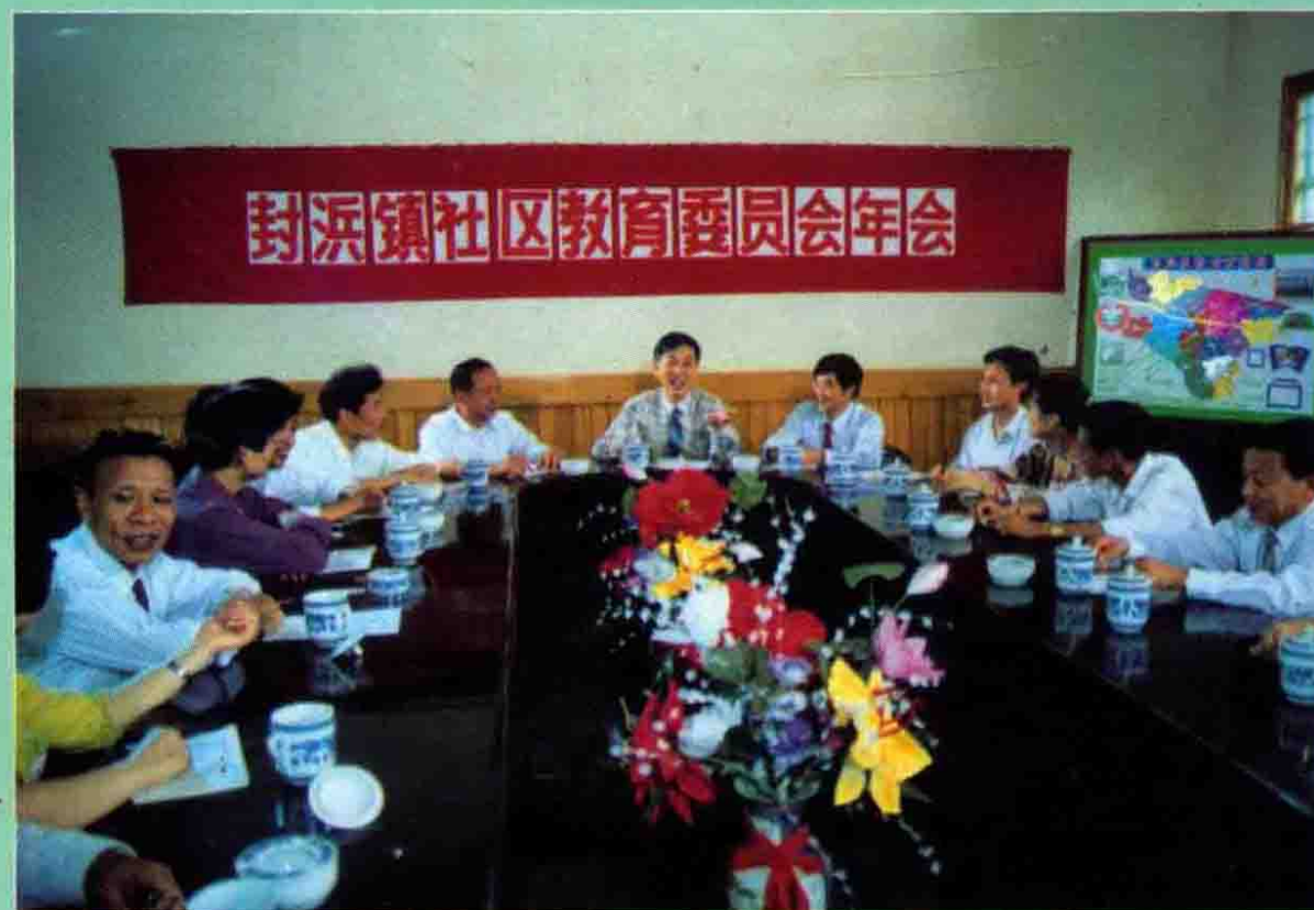
封浜镇社区教育委员会年会