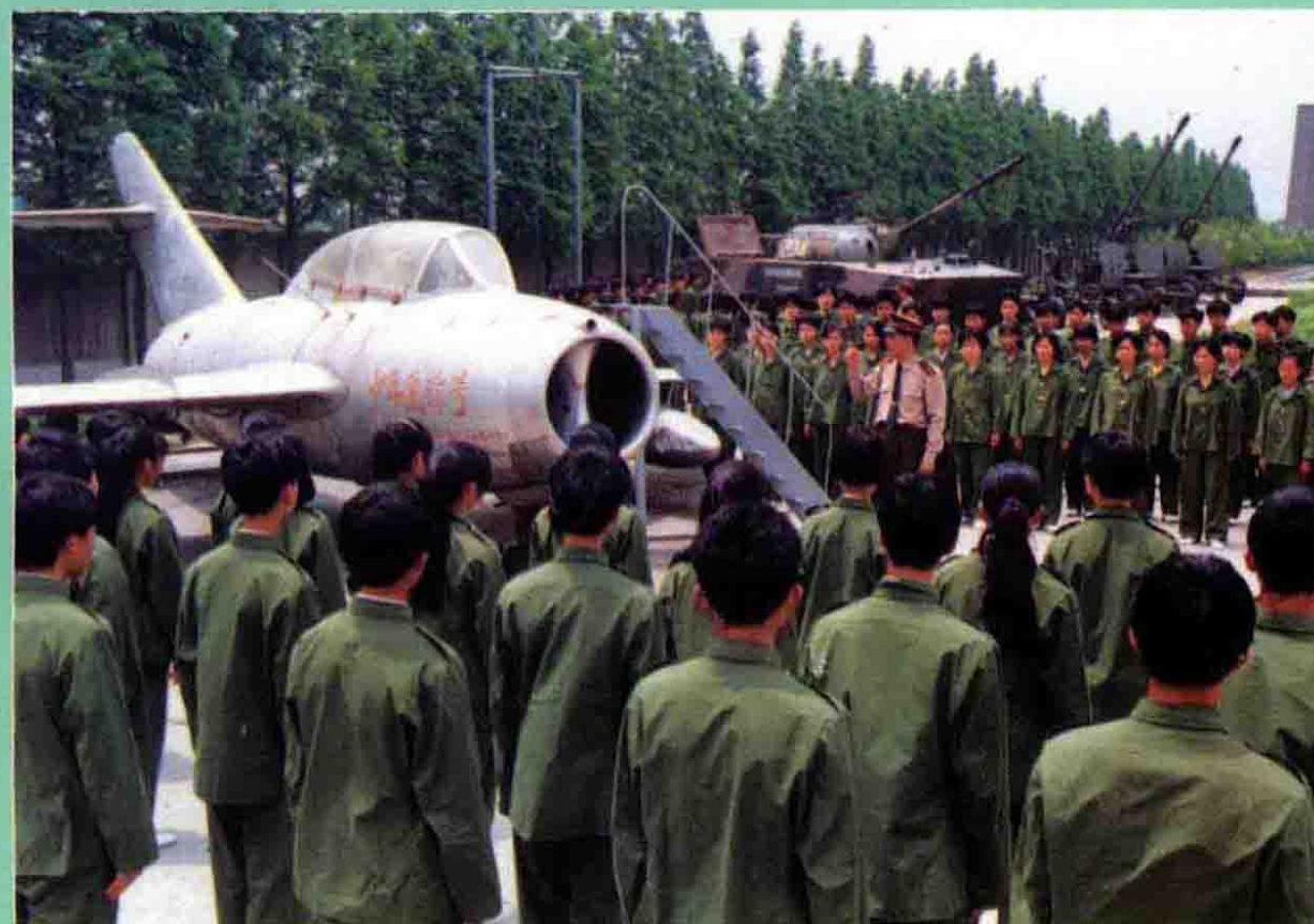
高一新生在區 國防學校軍訓