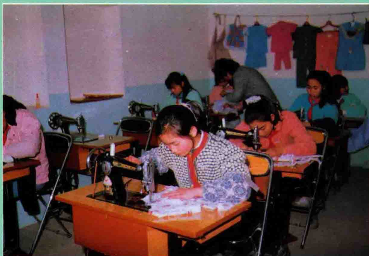
小学生在劳技 课上学缝纫