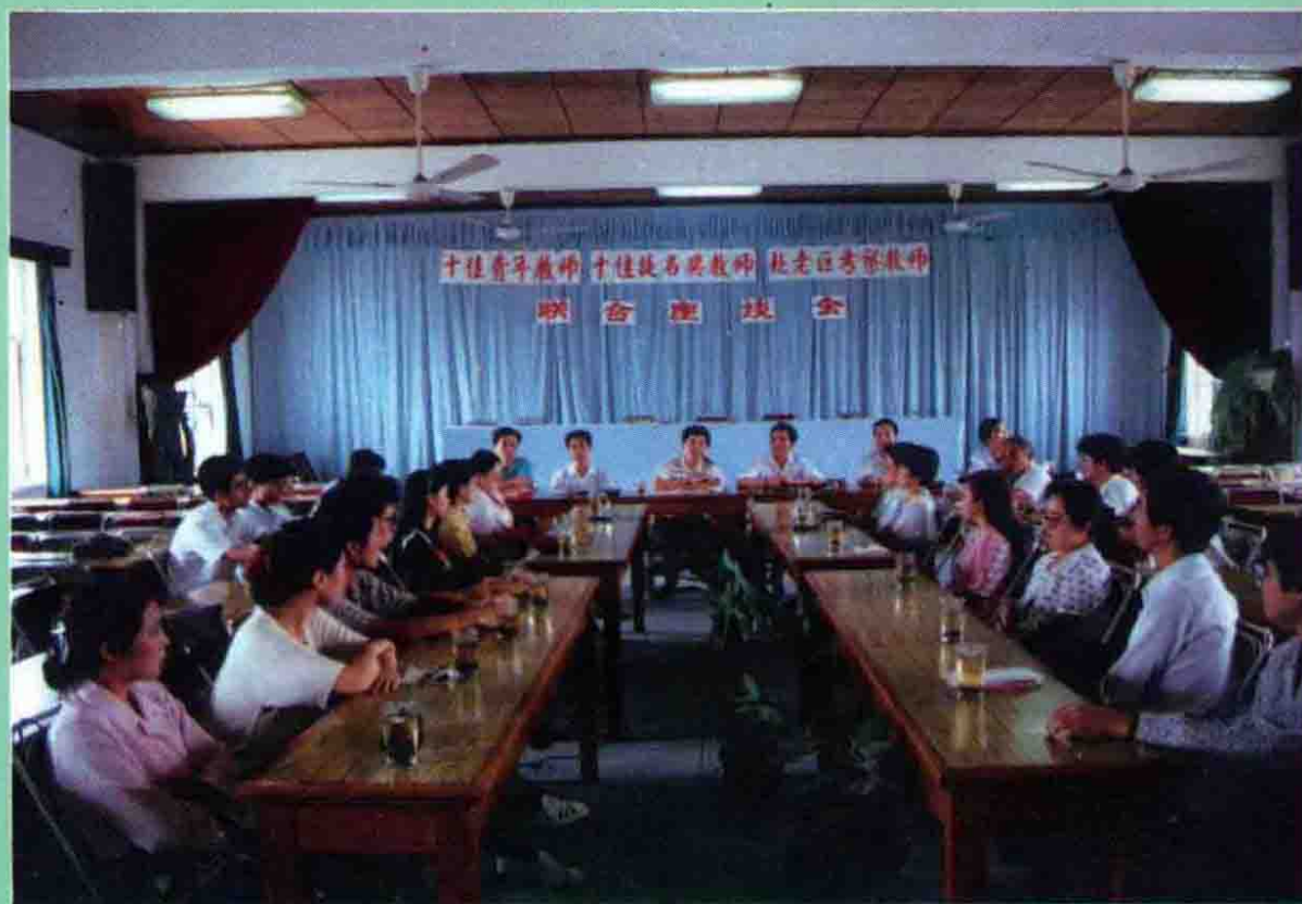
十佳青年教师 十佳提名奖教师 教师座谈会