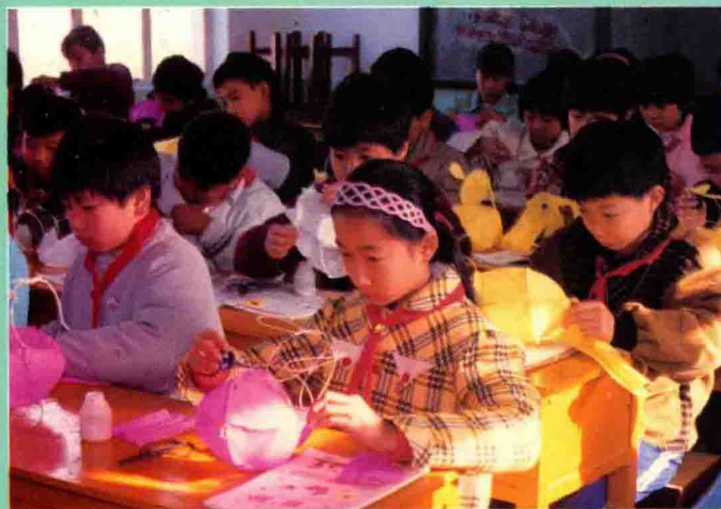
小学生制作兔子灯