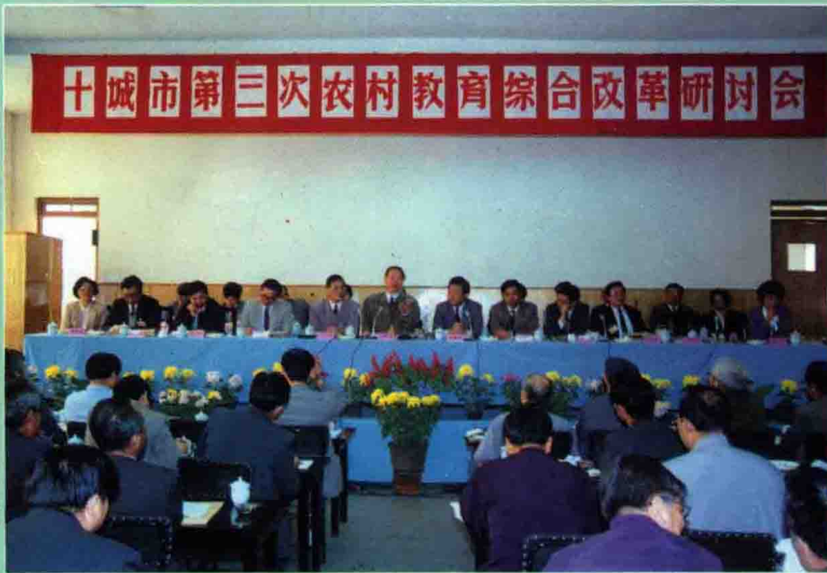
1993年10月,全国十城市第三次农村教育综合改革研讨会在嘉定召开