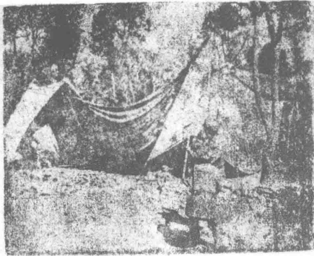
冀南军区 × 剧团 × 演出情形

八路军的剧 团在部队 中作文化娱 乐工作外， 剧团随部 队至一地， 就地搭起 布幕，与当 地居民举行 联欢会，图 示就地演出的 情形。