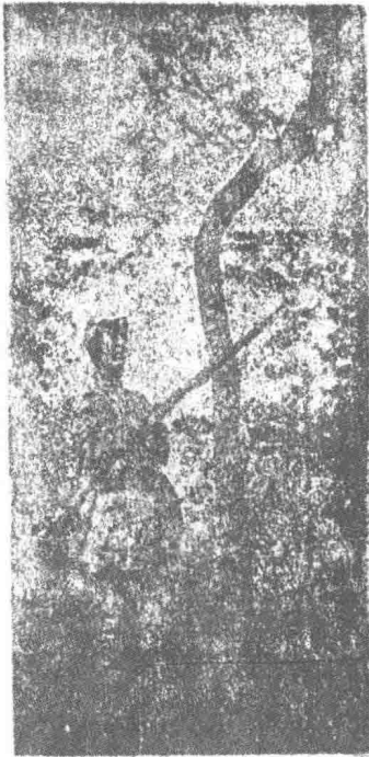
第二组 八路军在战斗中，经常处于战斗环境中，战士们随时都在战斗中。