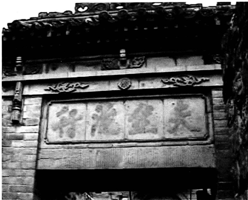
凌家大院甬道门楼上“夫然后行”题刻