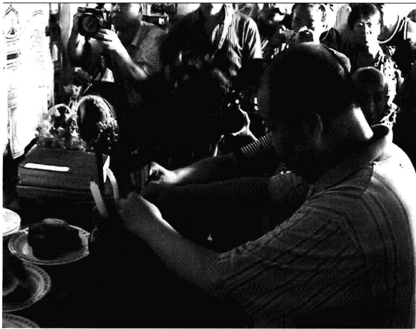
二月河在祖祠上香