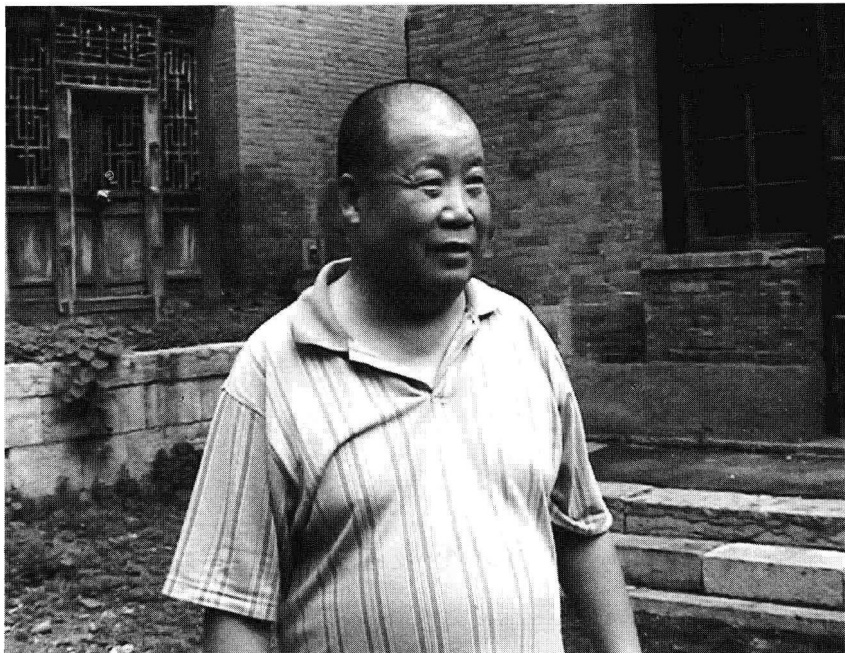
二月河在凌家大院

凌家大院充盈着一种神秘的文化氛围。当地人流传，凌家祖上在建筑之前，专请高人指点过，经悉心独到设计，方才动工。据说，凌家祖上在赴外经商中，偶然遇救一个江湖奇人，那人身怀绝技，专给达官贵人堪舆，他为凌家盛情所感，专程来到南庄，跋涉附近山水形胜，察看了凌家住宅地基，认为所处的物理地脉甚佳。“地势之聚，文运兴盛”，就把凌家大院设计成“福”、“喜”两个院，并在建院时，选一黄道吉日，先行在地基深层接脉气处嵌埋了一支名贵玉管为身、镶红宝石作笔头的玉笔，还加进了以金元宝、朱砂和小麦、黄豆、高粱、谷粟、玉米等五色粮配成的七样珍宝，作为辟邪和宅镇的祥瑞。最奇特的是，所设计的这两组院落又互相串连，与周围地形构成一个大大的墨水瓶，而宅院前有一株葱郁古树，恰如一支巨笔正在墨水瓶中润墨，寓意保佑凌家要出圣手巨擘。这番设计运筹，足显凌家先祖的良