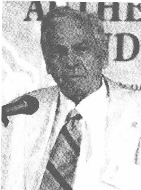
作者：尤斯塔斯·穆林斯（Eustace Mullins） （1923年3月9日 — 2010年2月2日）