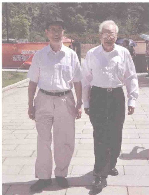
2013 年与台湾地区“司法院”前院长翁岳生先生在宁波奉化