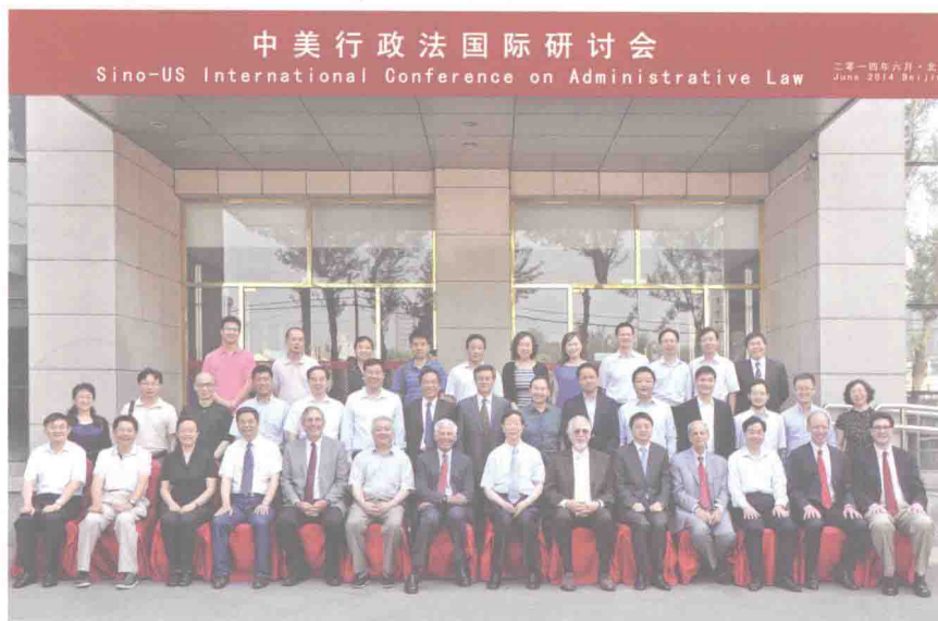
2014年中美行政法国际研讨会（北京）