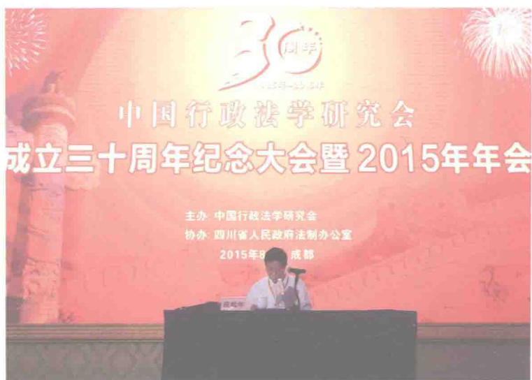
2015年在中国行政法学研究会2015年年会上（成都）