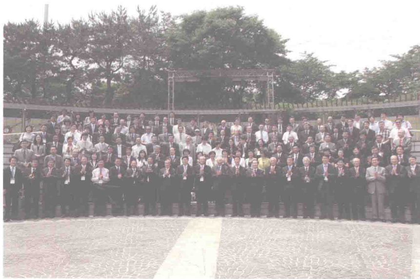
2012年6月第十届东亚行政法学学术研讨会全体代表合影（首尔）