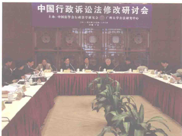
2011年行政诉讼法修改研讨会（广州）