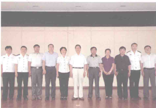
2010年6月在沈阳市城市管理行政执法局调研