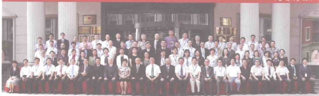
2011年第十三届海峡两岸行政法学学术研讨会（满洲里）