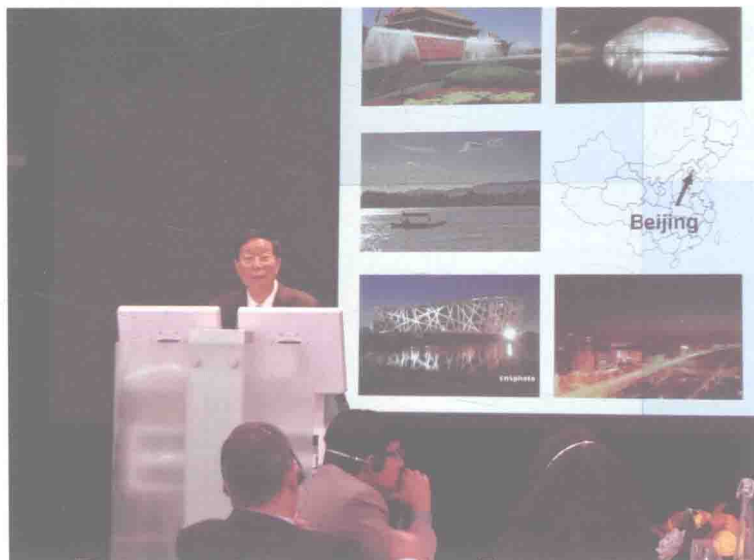
2011年11月在美国纽约国际控烟大会上介绍“北京市控烟立法的现状和未来”