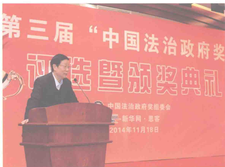
2014年在第三届“中国法治政府奖”评奖暨颁奖典礼上