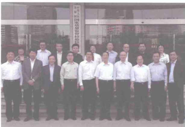
担任国家质量监督检验检疫总局法律顾问合影