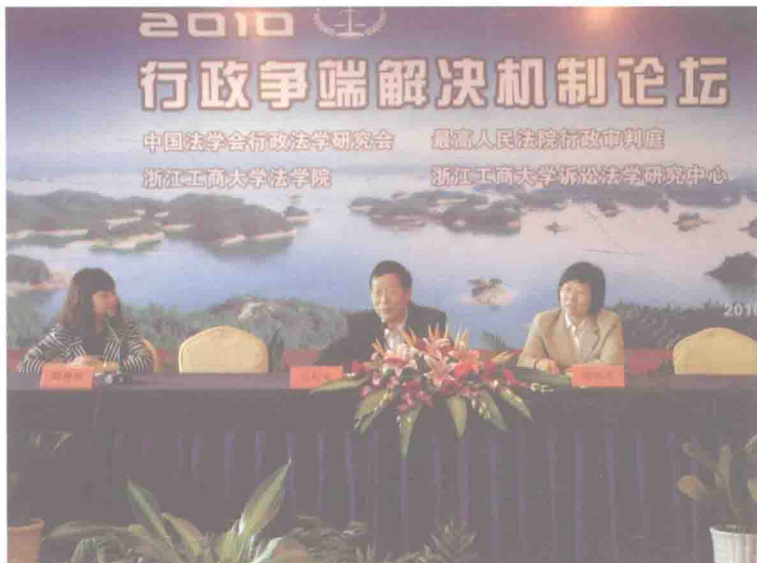
2010 年“行政争端解决机制论坛”（杭州）