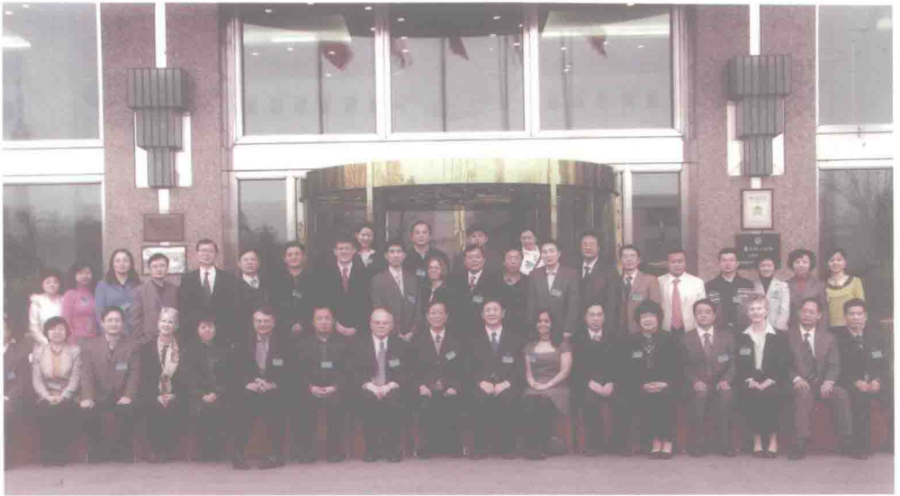
2008 年在中美土地征收和土地纠纷解决机制研讨会（北京）