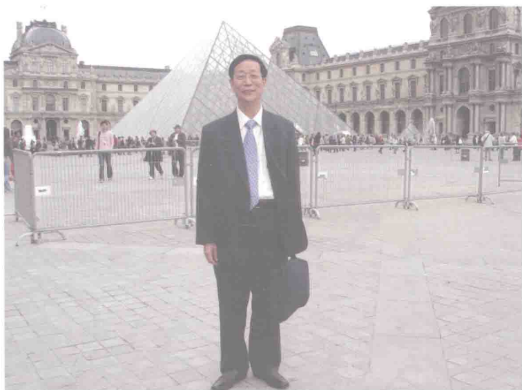
2009 年在法国卢浮宫前