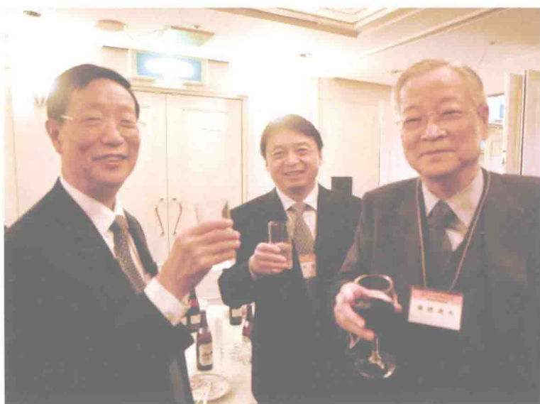
2010 年在第九届东亚行政法学学术研讨会上（东京）