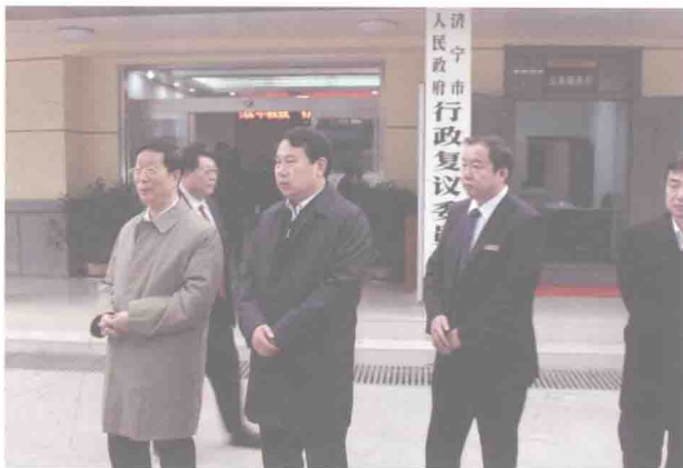
2010年考察济宁市行政复议委员会