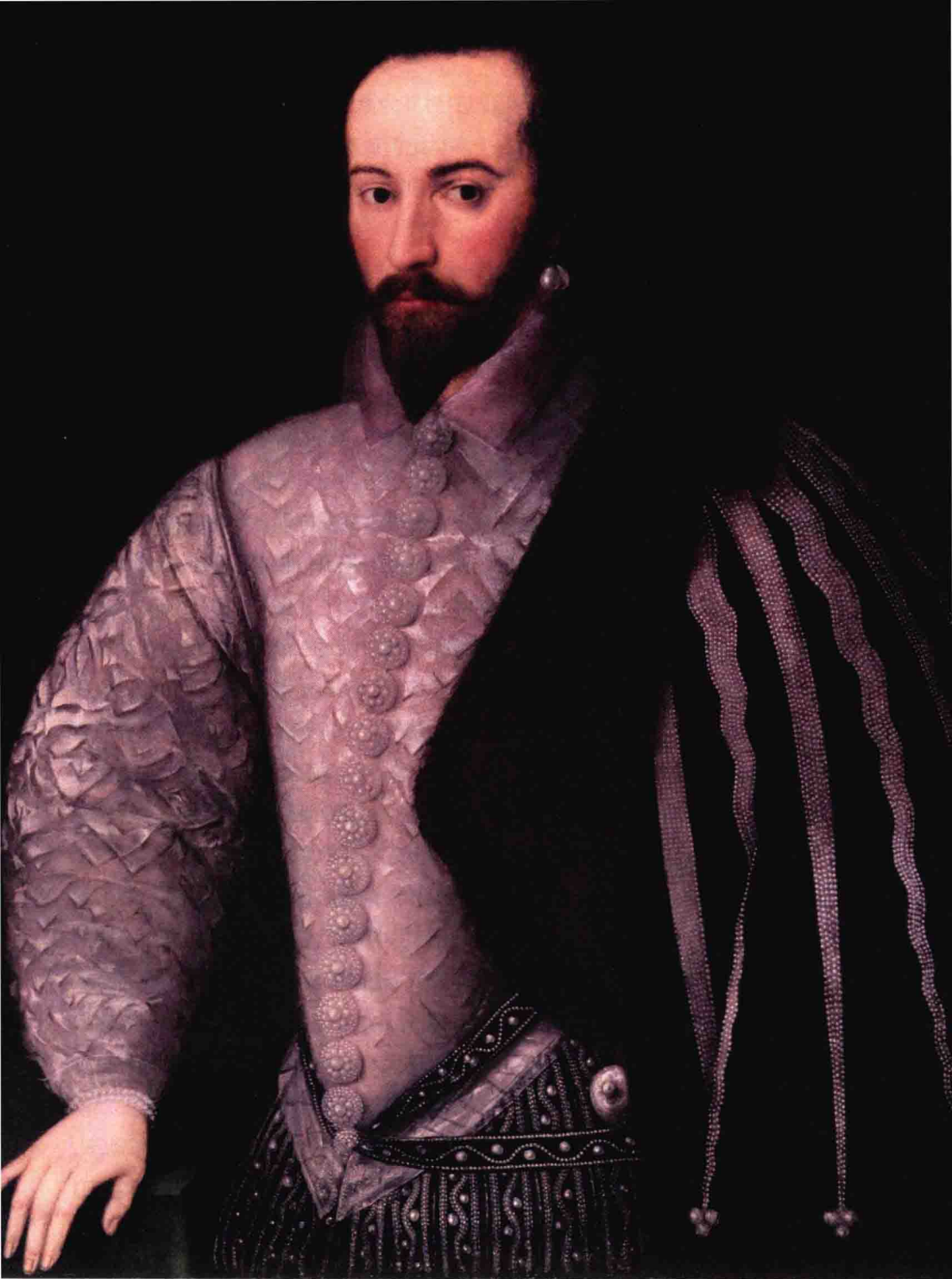
▲ 弗吉尼亚的建立者——沃尔特·罗利