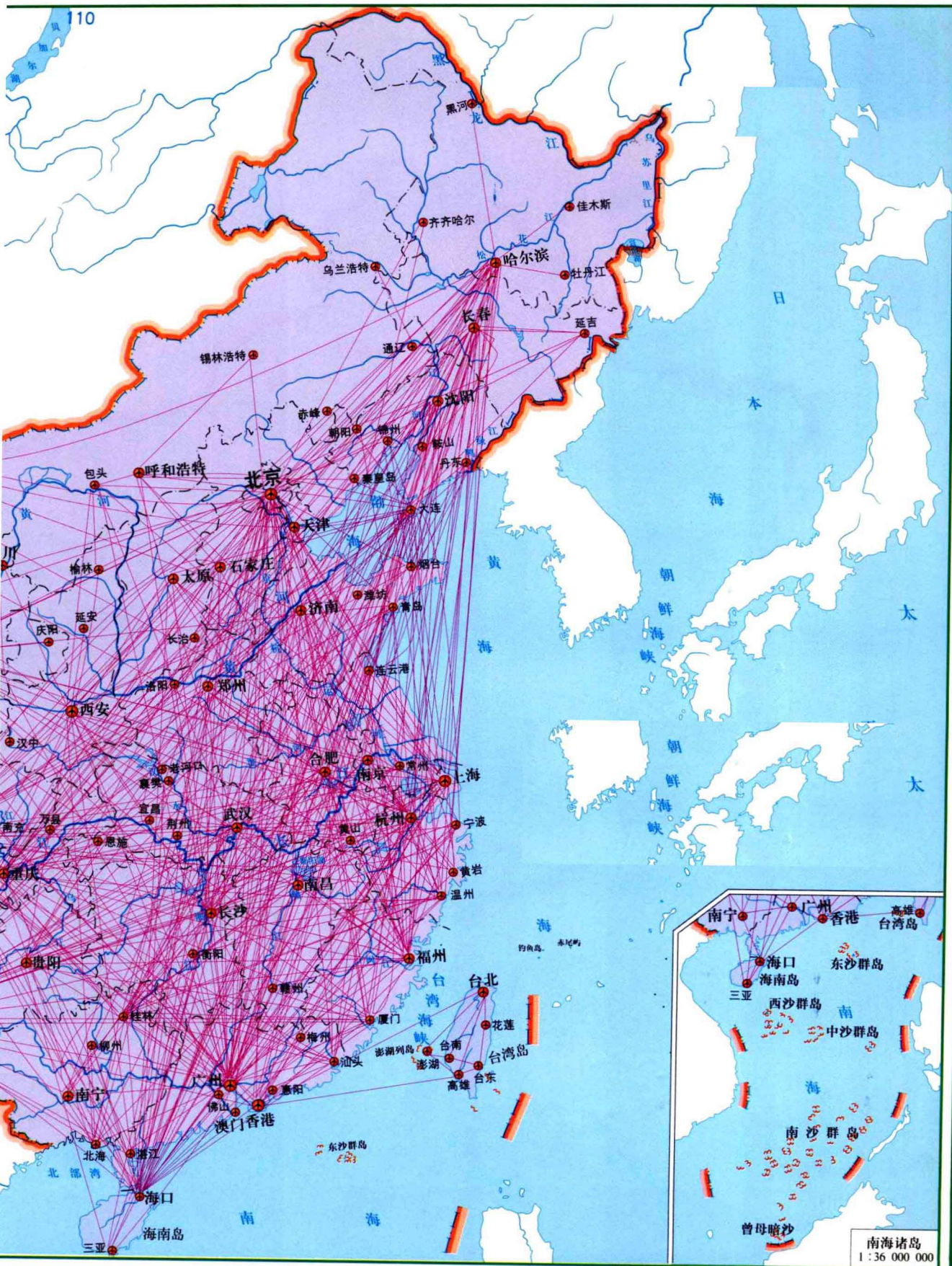
南海诸岛 1:36 000 000