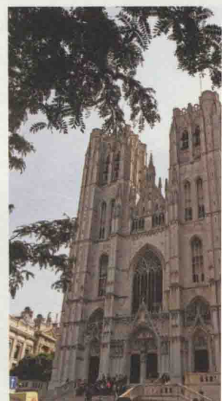
圣米歇尔和圣古都勒大教堂