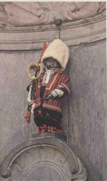
小于连不脱裤子不会被尿湿吗