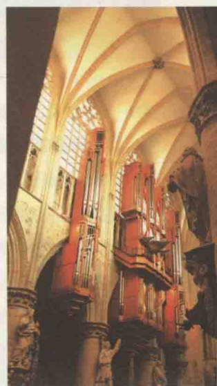
皇家埃斯博茨铸钟厂制造的巨大排钟