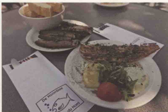
欧洲游第一次下馆子