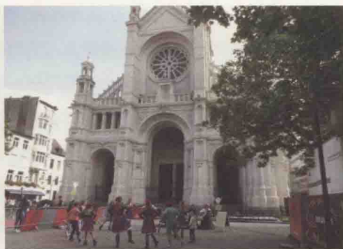
不清楚舞种，看大家围了个圈，姑且就称“圆圈舞”

听说小萨布隆（Petit Sablon）是一个精美的公园，进去后发现果真“精”：几条长椅容纳一二十人，一池碧水不过几米见方，好在小萨布隆“美”在其雕塑和喷泉，园区里的植物也都被精心修剪过。