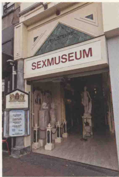
阿姆斯特丹性博物馆入口

的位置，甚至有人提出愿意免费供应啤酒只为能坐在这里看演出呢，没承想被我们这两个误打误撞的旅行客捡了便宜。