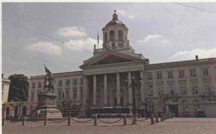
柯登堡圣雅各布教堂

原子球塔是布鲁塞尔的地标性建筑，1958年时为布鲁塞尔世博会而建，高102米，重2200吨，由九个巨大的不锈钢圆球连贯，从而构成相当于放大1650亿倍的 \alpha 铁的立方体晶体结构。每个圆球直径约18米，圆球内又分为上下两层。圆球和圆球之间由长26米、直径约3米的不锈钢管相连接。承担设计任务的是比利时著名建筑大师昂·瓦特凯恩，据说昂·瓦特凯恩当时之所以设计这样一个新奇的方案主要考虑了两个因素：一个寓意是当时的欧洲从第二次世界大战的阴影中走出来不久，正进入经济高速发展时期，用庞大的建筑来展示原子结构的微观世界，既表达人们对发展原子能美好前景的展望，同时也象征人类进入了科学、和平、发展和进步的新时代；另一个寓意是当时的欧共有9个成员国，比利时又刚好有9个省，这样原子球塔的整体造型正好成为比利时和欧共体的象征。原子球塔现在是一个科技馆，原子能、核技术等是其主要展览内容，最高处的圆球是一个专供游客观赏风景的观光区。原子球塔脚下满眼都是疯狂奔跑、尖声叫嚷的熊孩子，患有“小孩过敏症”的我根本没有兴趣挤进去参观，还是围着它在附近公园散步聊天更惬意。