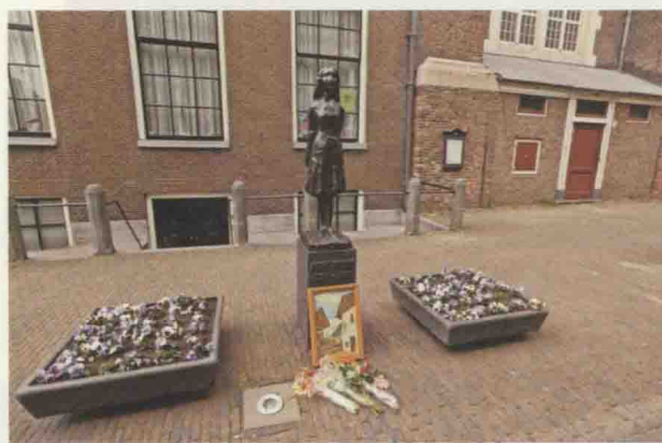
安妮之家附近的安妮铜像