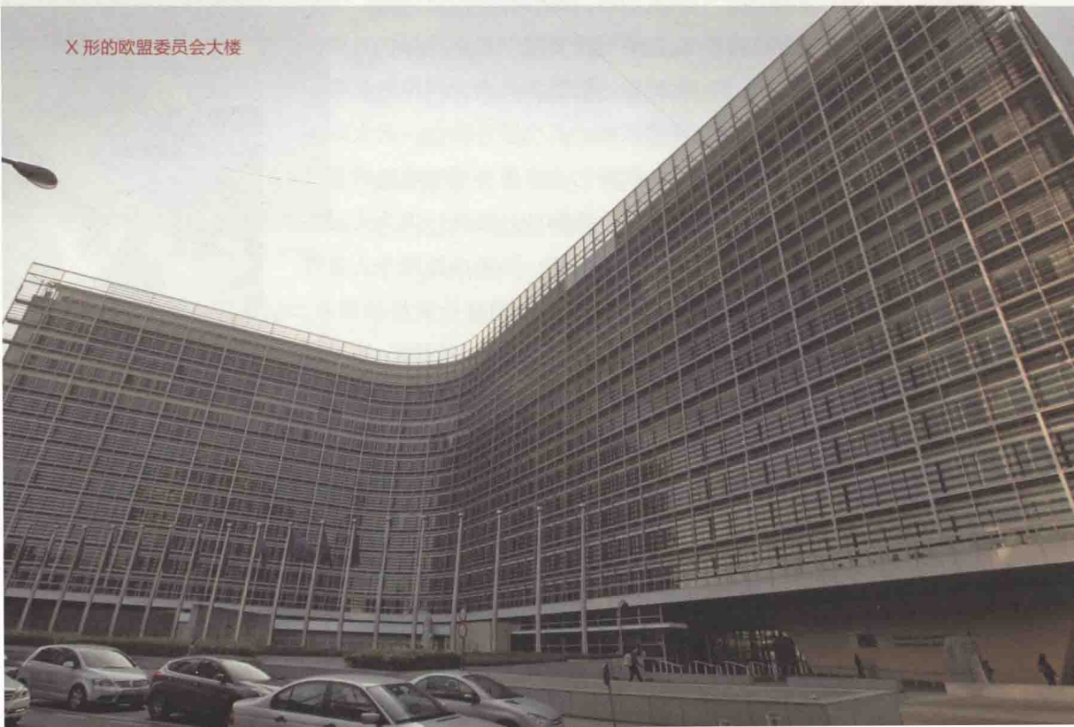
X 形的欧盟委员会大楼

酒店 14 点可以入住了，我们便返回酒店。途经柯登堡圣雅各布教堂、比利时皇家美术博物馆、布鲁塞尔皇宫、布鲁塞尔公园和比利时联邦议会。入住后将近 24 个小时以来第一次短暂休整便开始了，快速洗澡后两人当机立断再次出发前往原子球塔。因路程较远，这次地铁出行。布鲁塞尔地铁单一票价不计里程，单程 2.5 欧元，往返 4 欧元，买两张往返票刷卡进站。坐 20 站只用了 35 分钟，布鲁塞尔地铁站与站之间的距离可够短的。