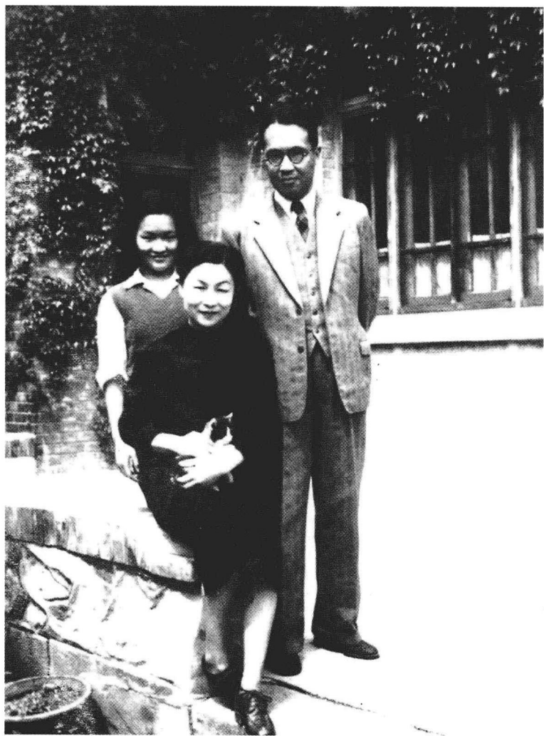
1950年摄于清华大学新林院宿舍，时正翻译《小癞子》