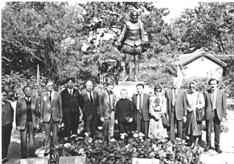
1986年10月，马德里市长送塞万提斯复制像到北京大学校园落户