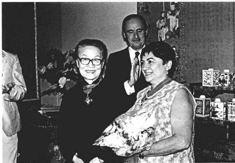
1986年10月6日，在西班牙驻华大使馆接受国王颁给的“智慧国王阿方索十世十字勋章”后与大使合影