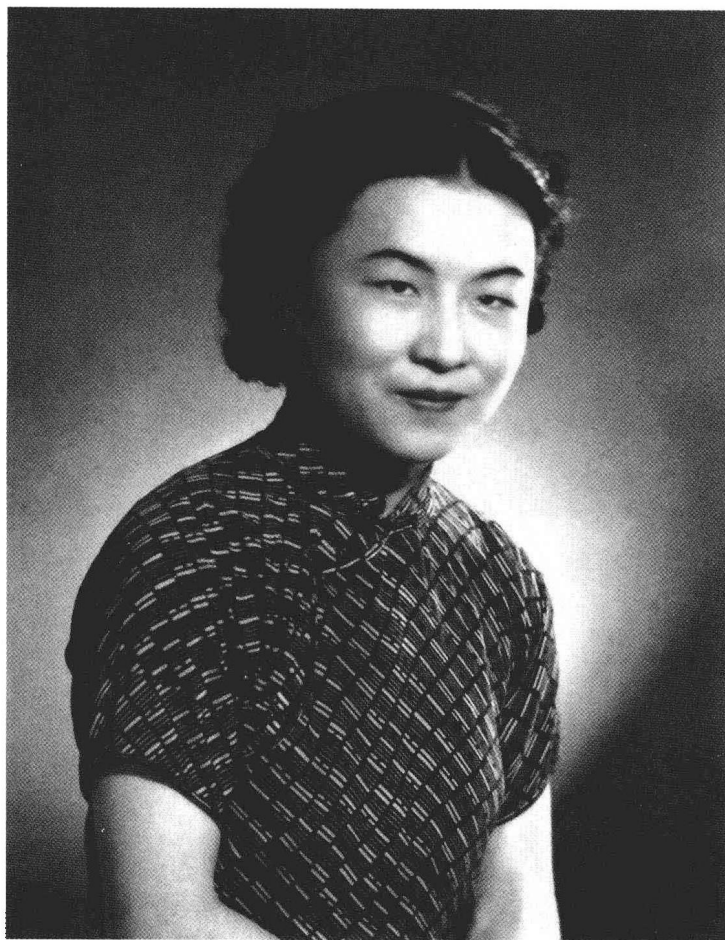
1941年夏摄于上海，时正在创作剧本