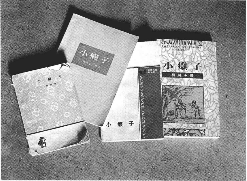
《小癞子》的几种版本