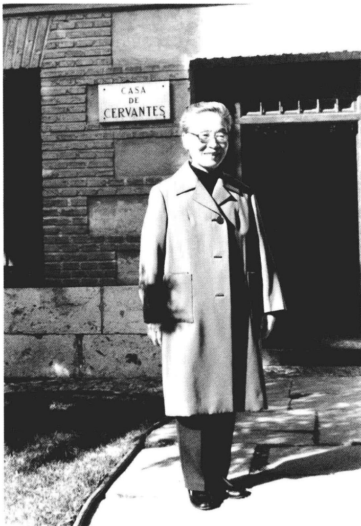
1983年11月摄于马德里远郊塞万提斯故居门前