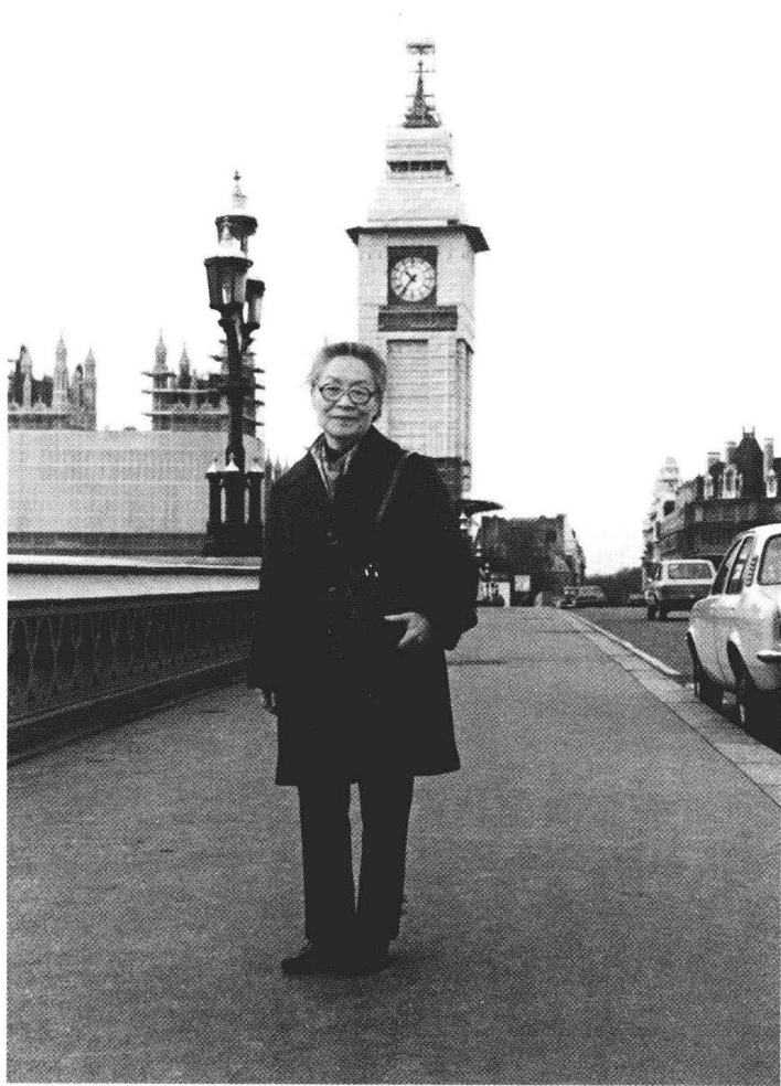
1983年冬在伦敦大本钟下