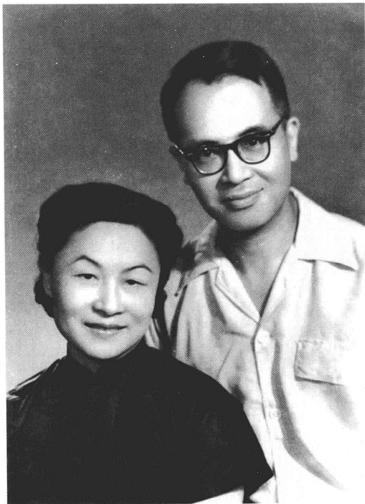
摄于1962年，时正开始由西班牙语原文翻译《堂吉诃德》