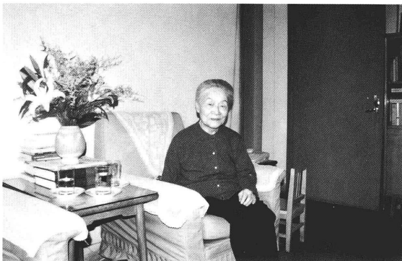
2000年摄于三里河家中，时已译完《斐多》