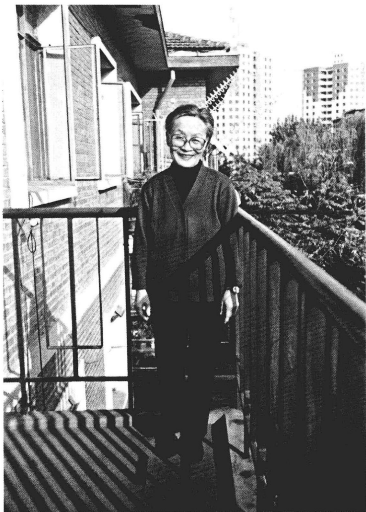
1985年摄于三里河寓所，《堂吉诃德》时已出版七年，重新校订一过