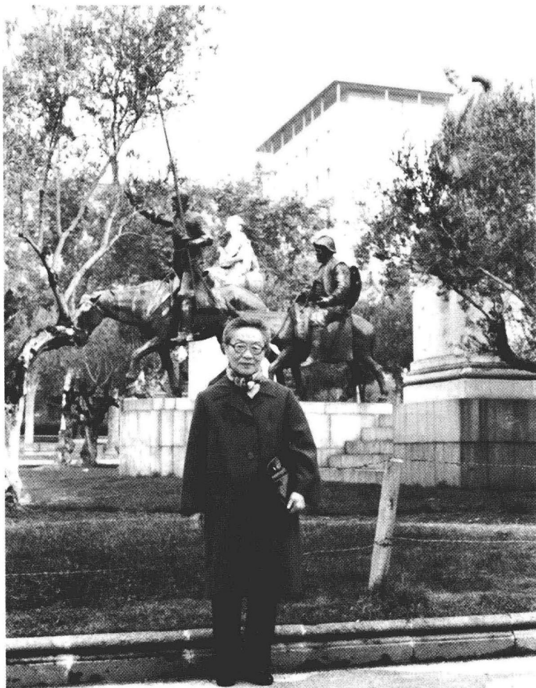
1983年11月摄于西班牙广场堂吉河德铜像前