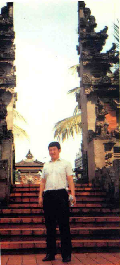
1994 年访问印度尼西亚