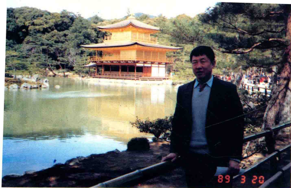
1989 年应邀到日本讲学参观金阁寺