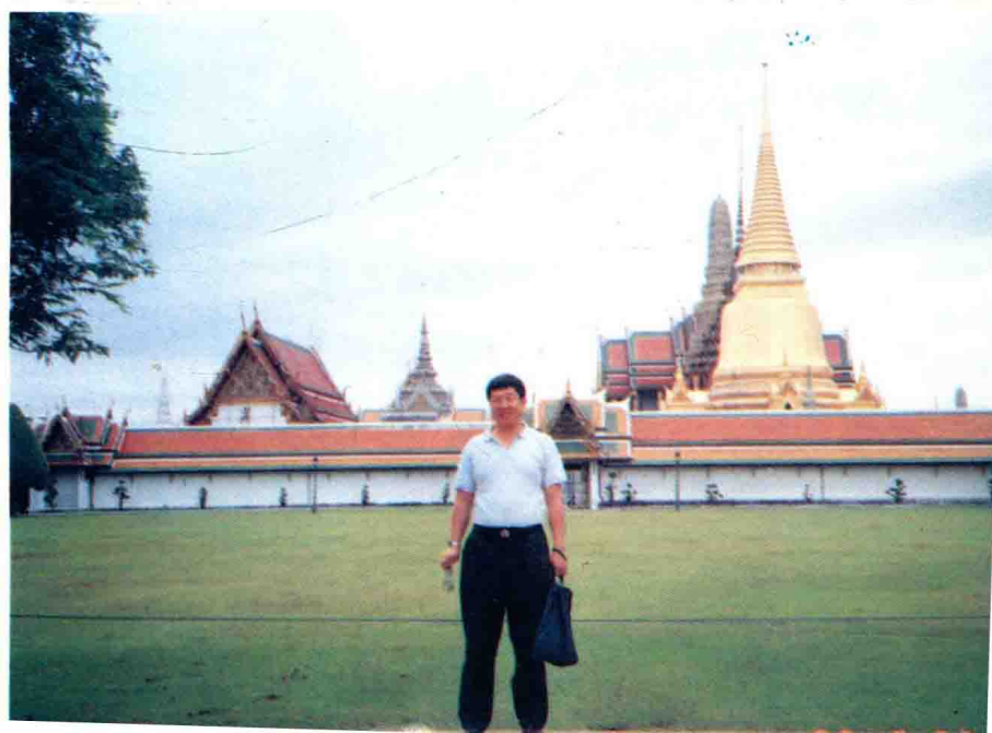
1992 年访问泰国参观曼谷大王宫