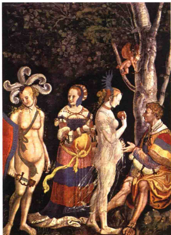
图6 尼古拉斯·曼纽尔·多伊奇《帕里斯的判决》(1517-1518),布面蛋彩画。瑞士巴塞尔 Offentliche 艺术博物馆