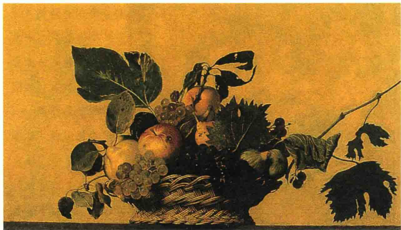
图5 米开朗基罗·达·卡拉瓦乔《水果篮》(约1600),布面油画。米兰安布罗齐亚纳美术馆

绘画作品中的苹果不具有宗教含义也是可能的。譬如在《帕里斯的判决》中,希腊神话故事中的3个女神比美,来自人间的帕里斯将代表获胜的苹果判给了阿芙罗狄蒂(罗马的维纳斯女神)。而且16世纪以后,许多画家在表现那个传说的选美比赛时,都将水果当做伟大的性