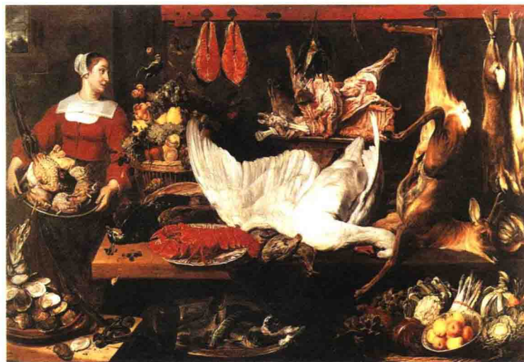
图2 佛兰斯·斯莱德斯《食品储藏室》(约1620), 布面油画。布鲁塞尔比利时皇家艺术博物馆