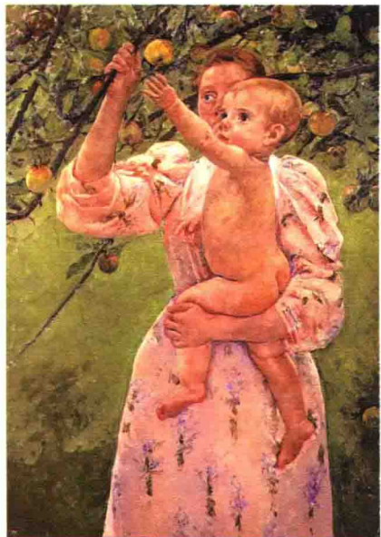
图4 玛丽·卡萨特《摘苹果的婴孩》(1893), 布面油画。里士满弗吉尼亚艺术博物馆

己作品的主题——儿童的关爱的思考。尽管卡萨特本人一生未婚,也没有孩子,但她却思考着性的意义及其后果,以及伊甸园的原罪和婴儿的魅力。对于人性的重大问题,卡萨特进行了思考,却没有下结论,而是故意留下自由想象的空间。这正是19世纪后期典型的象征主义。和当时许多食物画一样,这些作品都试图探讨我们所食用的东西的深刻意义。