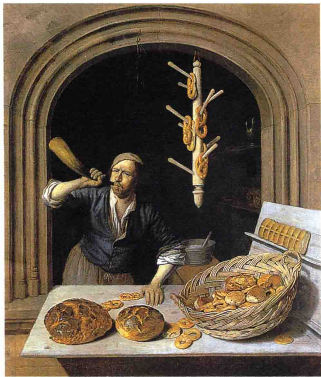
图7 乔布·贝克福德《烤面包师》（约1681），马萨诸塞渥斯特艺术博物馆

有些作品清清楚楚地描绘弥撒活动的圣饼、圣酒以及圣杯和仪式所需的其他物品，或者描绘耶稣基督主持作为教堂圣礼的圣餐的场景，它们的宗教意味毋庸置疑。但是像乔布·贝克福德描绘面包师傅的那幅作品（图7）又该怎么看呢？难道它表现的仅仅是荷兰面包店主吹响号角，通告货品已经备好、敬请大家光临吗？画面上，面包、卷饼、脆饼等生