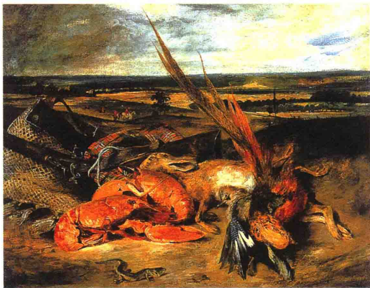
图1 尤金·德拉克洛瓦《龙虾静物画》(1826-1827), 布面油画。巴黎卢浮宫艺术博物馆