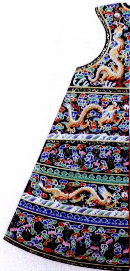
图10-258 清皇后 ①式朝褂设计小样 纸长40厘米，宽48厘米 北京故宫博物院藏(曾发表于《中国龙袍》)