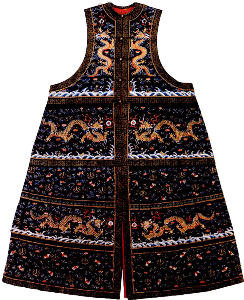
图10-259 清光绪 ①式皇后朝褂 胸围线以上前后绣立龙各二条，胸围线以下横分四层，第一、三两层各绣行龙前后各两条，第二、四两层分别绣万福（蝙蝠）万寿 北京故宫博物院藏（曾发表于《中国龙袍》）