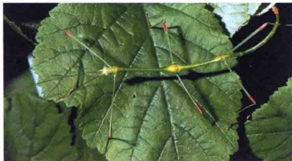
图 1-2 拟态伪装术

如果说隐身和拟态伪装还属于被动伪装范畴，那么乌贼施放烟幕避敌则是生物采用主动干扰方法实施伪装以求生存的典范（见图 1-3）。解剖实验表明，乌贼体内有一个专门用来存储黑色液体的“墨囊”，当乌贼遇到侵害时，就会从“墨囊”中喷出与自己形态相似黑色浓液，悬浮在水中。当敌害碰到时，浓液会“爆炸”，并在周围形成一层浓黑的烟幕。