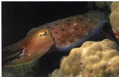
图 1-3 干扰伪装术

对生物伪装的研究以及由此而衍生的生物伪装技术，大大提高了人类军事伪装术的效能。与传统的伪装方法相比，生物伪装术主要有以下四个方面的优点 [8] ：