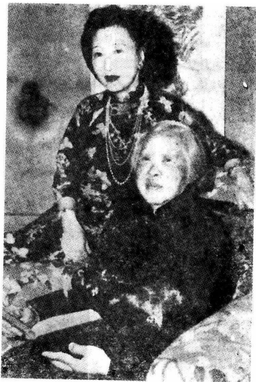
在华盛顿和母亲在一起，时在1947年她去世前不久。