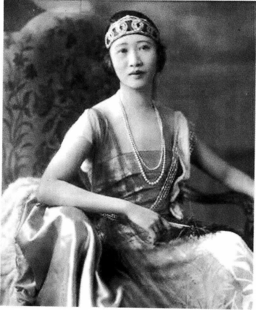
黄蕙兰（顾维钧夫人）