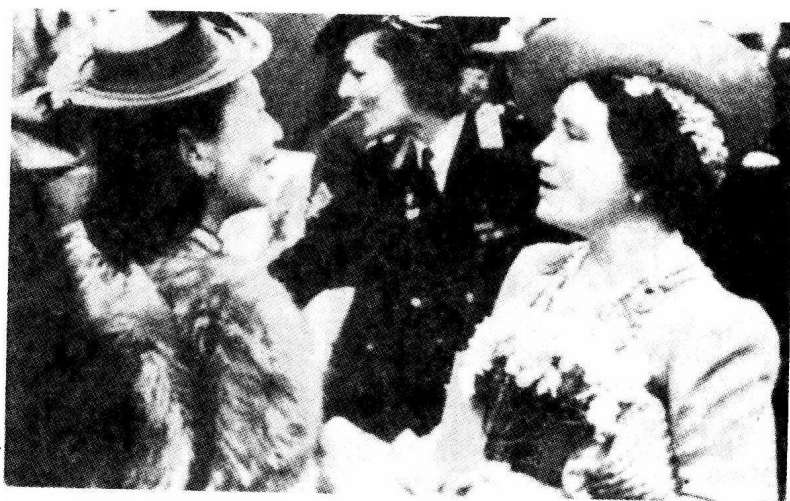
1944年伊丽莎白王后（后来是王太后）出席红十字会慈善募捐的花园招待会。后立者为爱德薇娜·蒙巴顿，红十字会领导人。