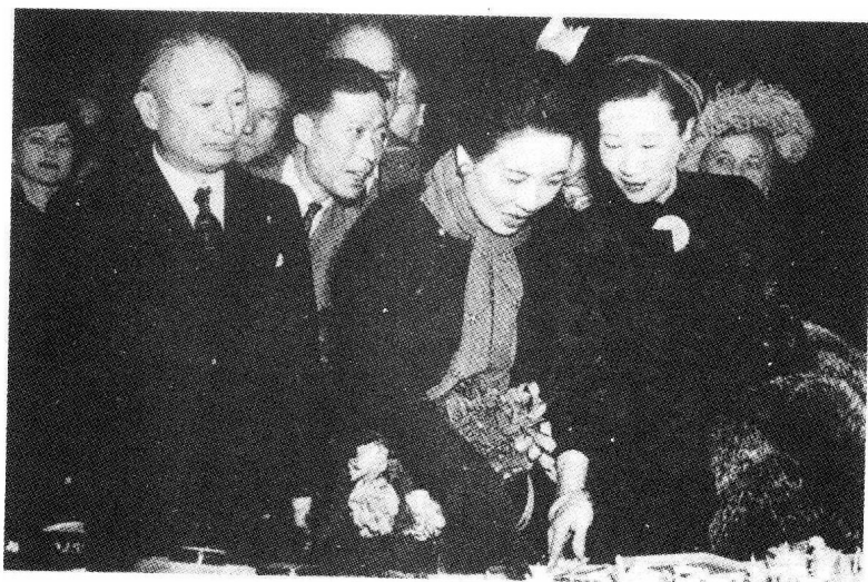
蒋夫人、顾维钧和我在华盛顿出席一慈善事业的聚会。