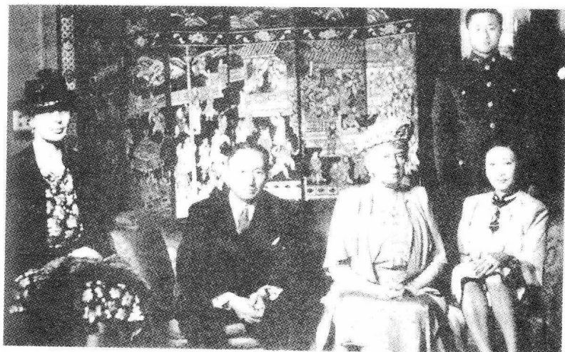
1944年英国玛丽王太后由她的侍女从官陪同首次访问伦敦中国大使馆茶叙。二儿子福昌后立，即将参军。