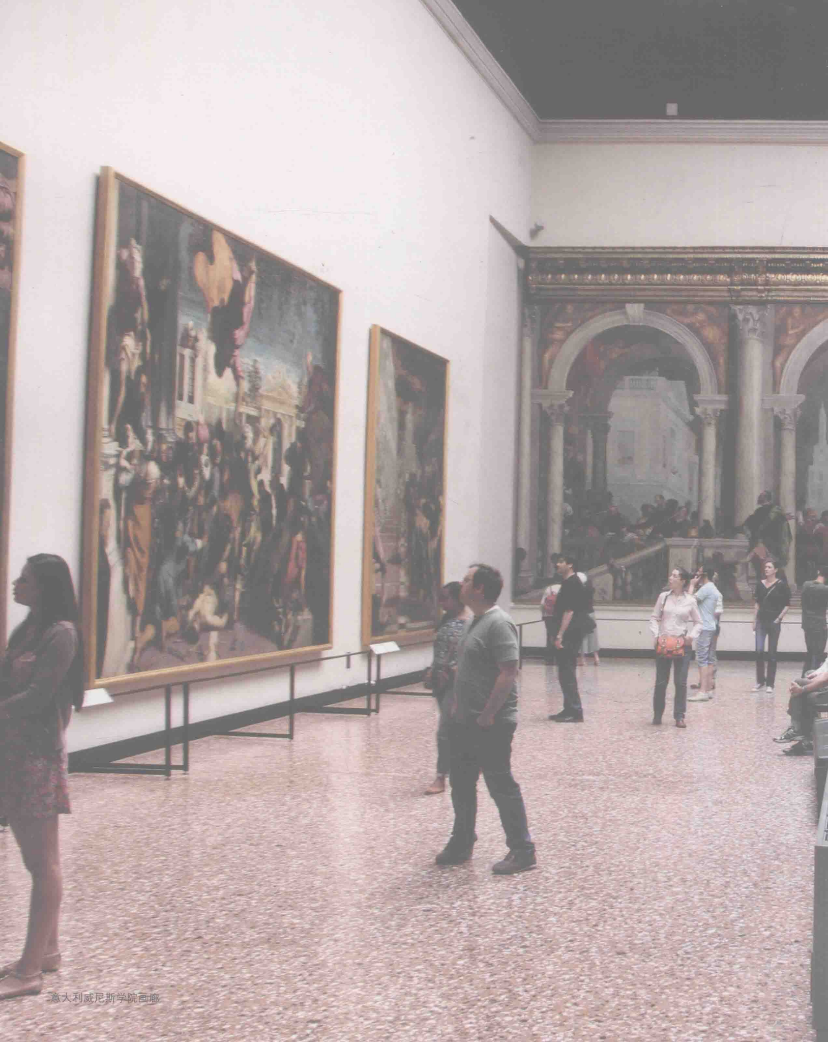
意大利威尼斯学院画廊