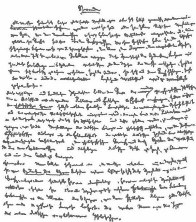
《德意志意识形态》手稿的第一页：序言

比利时首都布鲁塞尔，同年4月，马克思的战友恩格斯也迁居到这里，两人正式开始并肩战斗，他们所做的第一项工作，就是对《神圣家族》中所初步阐述的唯物史观进行进一步深入的研究，这一研究成果就是两人合著的《德意志意识形态》。虽然在1845年春天两人就已经决定共同撰写这部著作，但该著作的真正写作时间为1845年秋季至1846年夏季。