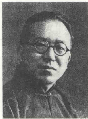
图 2-1-1 金城

在英国伦敦铿司大学（King's College）攻读法律，又前往美国、法国考察法制以及美术。回国后初任上海公共租界会审廨襄谏委员，后被聘为编订法制馆、协修奏补大理院刑科推事等。中华民国成立后，任众议院议员、国务秘书。他参与筹备古物陈列所，倡议将故宫内库及承德行宫所藏金石、书画于武英殿陈列展览，供民众和画家研究学习。金城酷爱传统绘画，临摹了大量古代珍品。他还是一位颇有革新思想的艺术