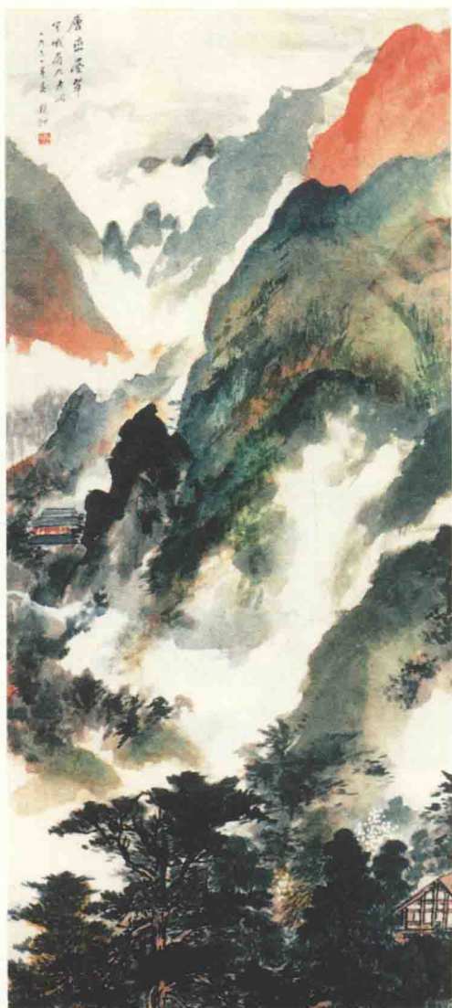
图 2-1-3 吴镜汀《层峦叠翠》，纸本设色，纵 104 厘米，横 47.7 厘米，1961 年作。中国美术馆藏

北京。17岁入中国画学研究会，师从金城研习古画，还随金城等画家赴日参加中日绘画联展。上世纪三十年代初，任教于京华美术学院。1954年任中央美院民族美术研究所副研究员，1958年参加筹备成立北京画院，任副院长。后来任中国美术家协会理事和书记处书记。吴镜汀的艺术造诣深湛，从“四王”特别是王石谷入手，涉猎宋、元、明、清各家，同时注重写生，能将传统与造化熔为一炉。其前半生的山水画作品较为工细，能综合运用古法，并结合自身体悟进行探索，画风清新雅致。解放后他遍游名山大川，从写生中求变化，因此其后期的作品更注重意境的刻画，着色绚丽，有时用没骨法，有时用泥金勾勒，别有韵致。启功曾随其学书画。值得注意的是，吴镜汀作于1961年的《层峦叠翠》（图2-1-3）显示了一些源自其师金城的艺术气韵，此作色彩运用较为丰