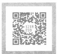
教师职业道德规范